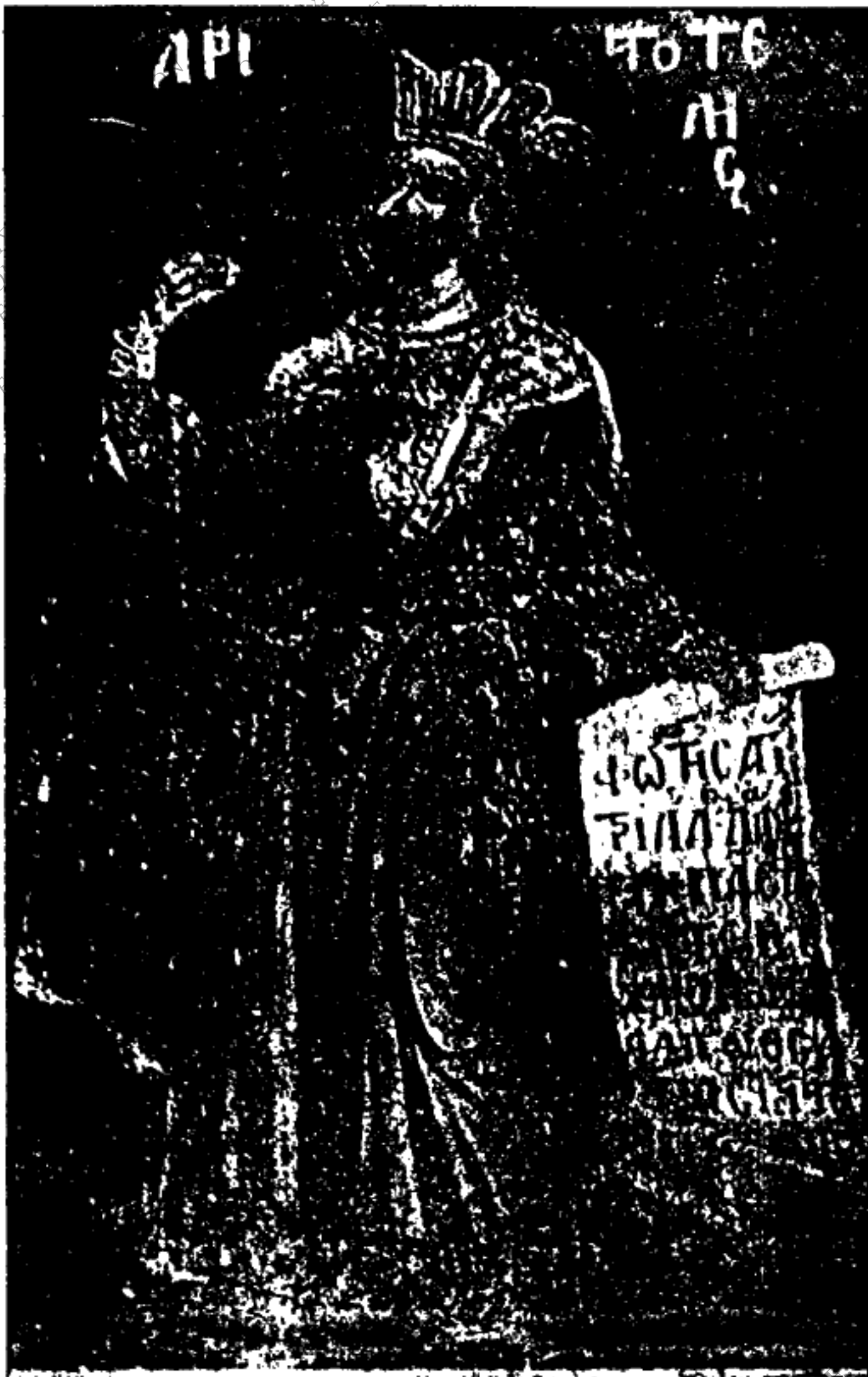
Εικ. 8. - Ἀριστοτέλης.