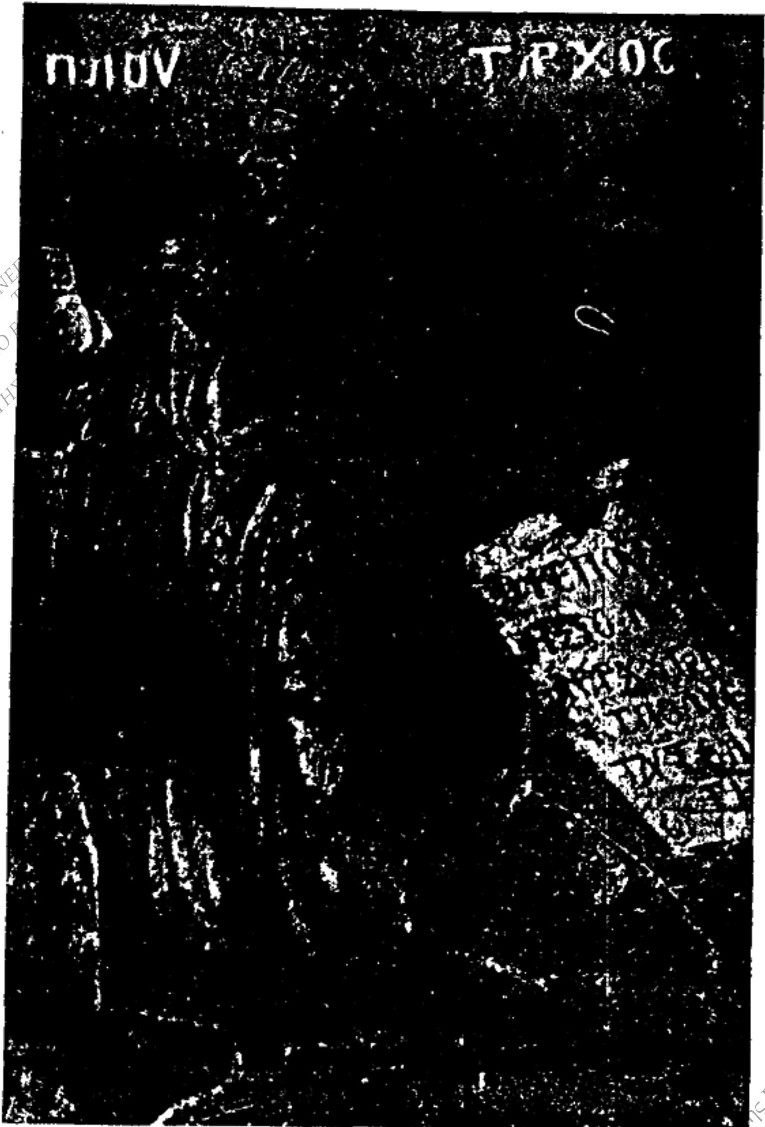
Εἰκ. 12. - Πλούταρχος.

ΠΑΝΕΠΙΣΤΗΜΙΑΚΟ ΕΡΓΑΣΤΗΡΙΟ ΦΩΤΟΓΡΑΦΙΑΣ ΔΙΕΥΘΥΝΤΗΣ