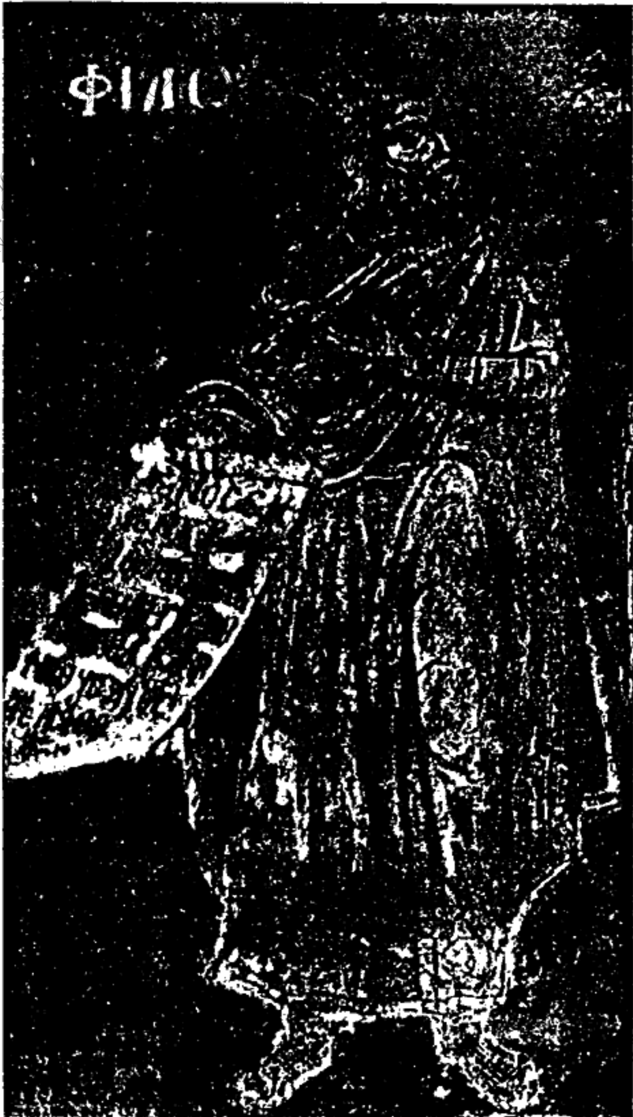
Εἰκ. 6. - Φίλων.