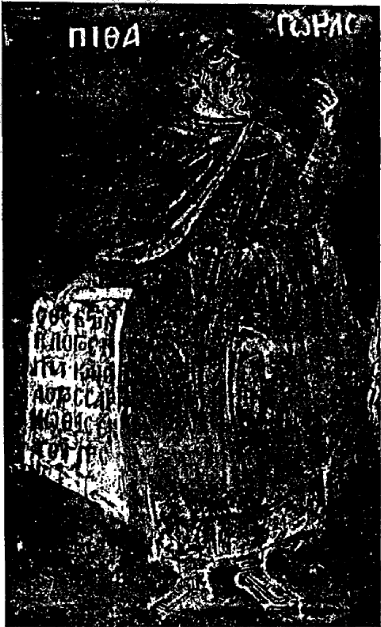
Εικ. 2. - Πυθαγόρας.

ΠΑΝΕΠΙΣΤΗΜ ΤΟΜΕΑΣ ΕΡΓΑΣΤΗΡΙΟ ΕΡΕΥΝΩΝ ΔΙΕΥΘΥΝΤΗΣ: ΕΠ. ΚΑ