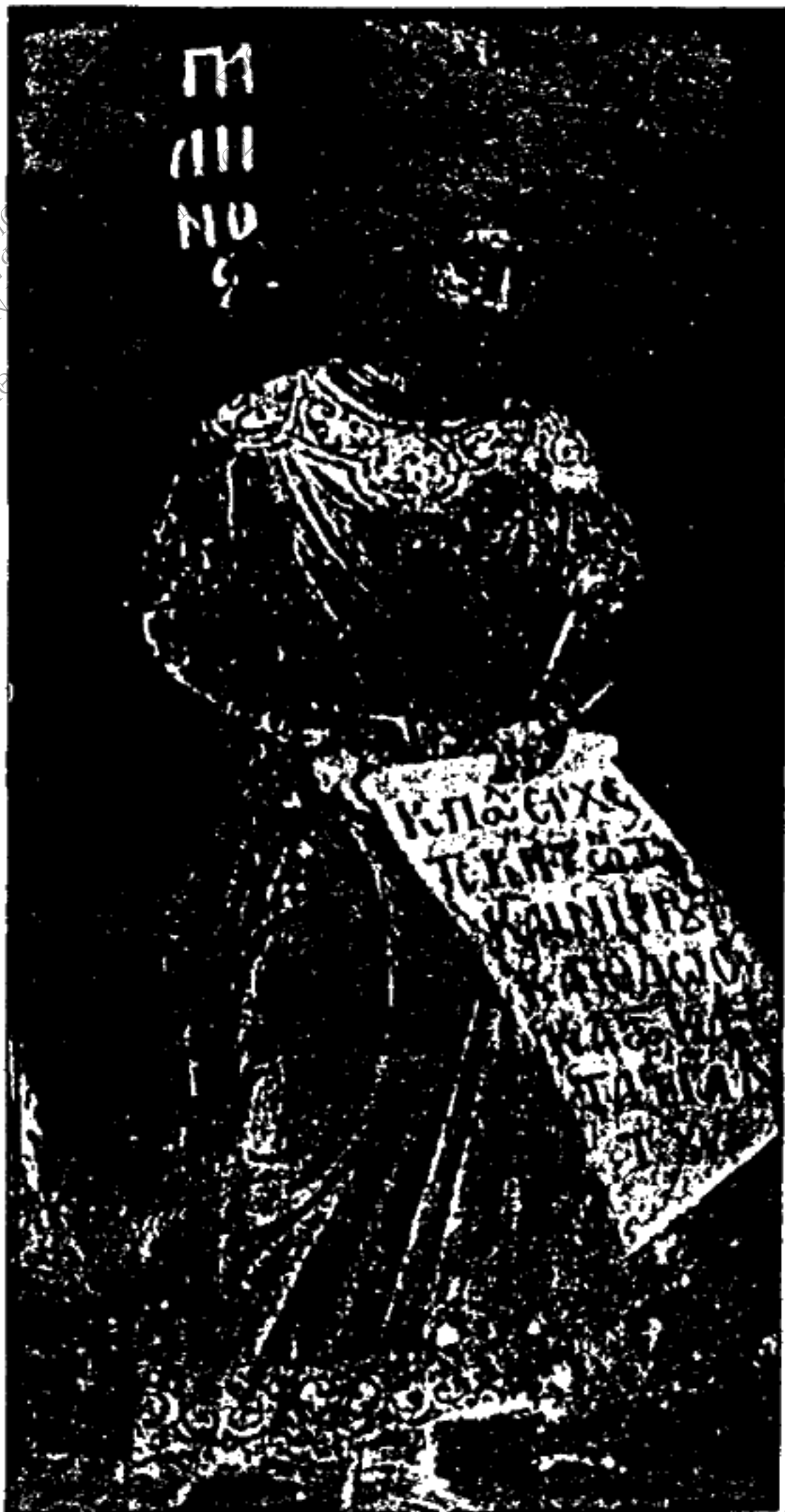
Εἰκ. θ. - Γαλιηός.

ΠΑΝΕΠΙΣΤΗΜΙΟ ΤΟΜΕΑΣ ΕΡΓΑΣΤΗΡΙΟ ΕΡΕΥΝΩΝ ΔΙΕΥΘΥΝΤΗΣ: ΕΠ. ΚΑΘ.