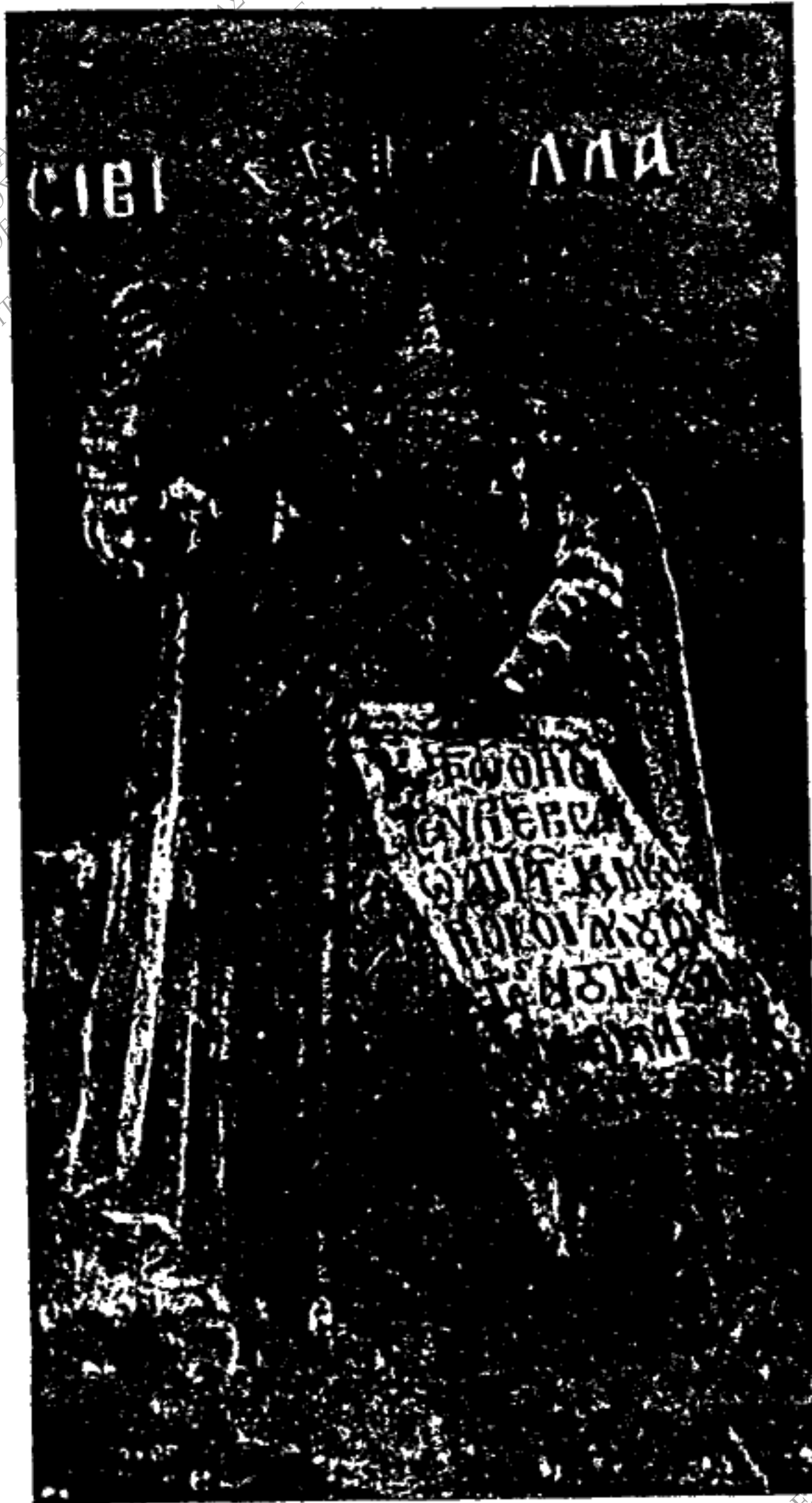
Εἰκ. 10. - Σιβύλλα.

ΠΑΝΕΠΙΣΤΗΜΙΟ ΙΩΑΝΝΙΝΩΝ ΤΟΜΕΑΣ ΦΙΛΟΣΟΦΙΑΣ ΕΡΓΑΣΤΗΡΙΟ ΕΡΕΥΝΩΝ ΝΕΟΕΛΛΗΝΙΚΗΣ ΔΙΕΥΘΥΝΤΗΣ: ΕΠ. ΚΑΘΗΓΗΤΗΣ