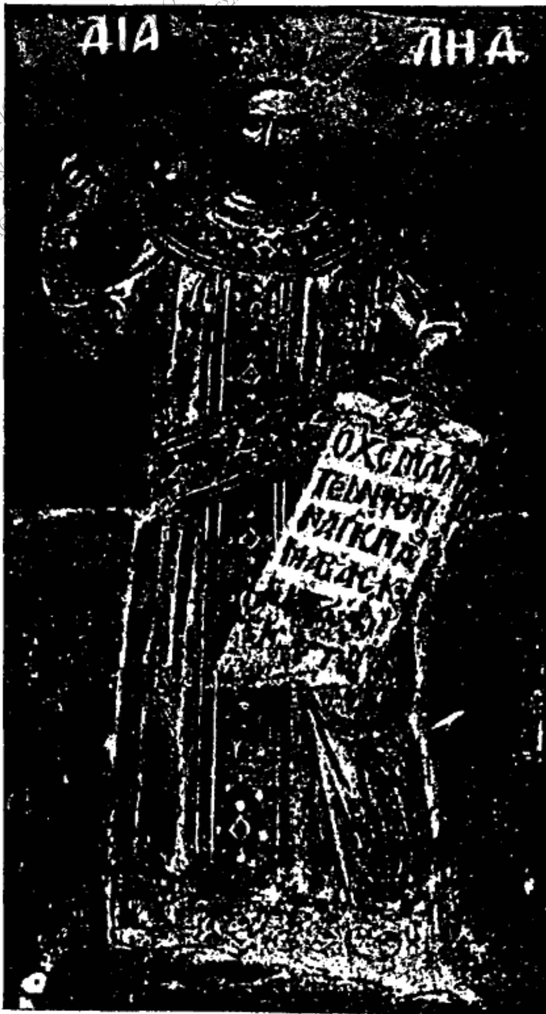
Εικ. 3. - Αιαλία.

(Πιθανῶς πρόκειται περὶ τῆς Ἀλεξανδρινῆς φιλοσόφου Ὑπατίας).