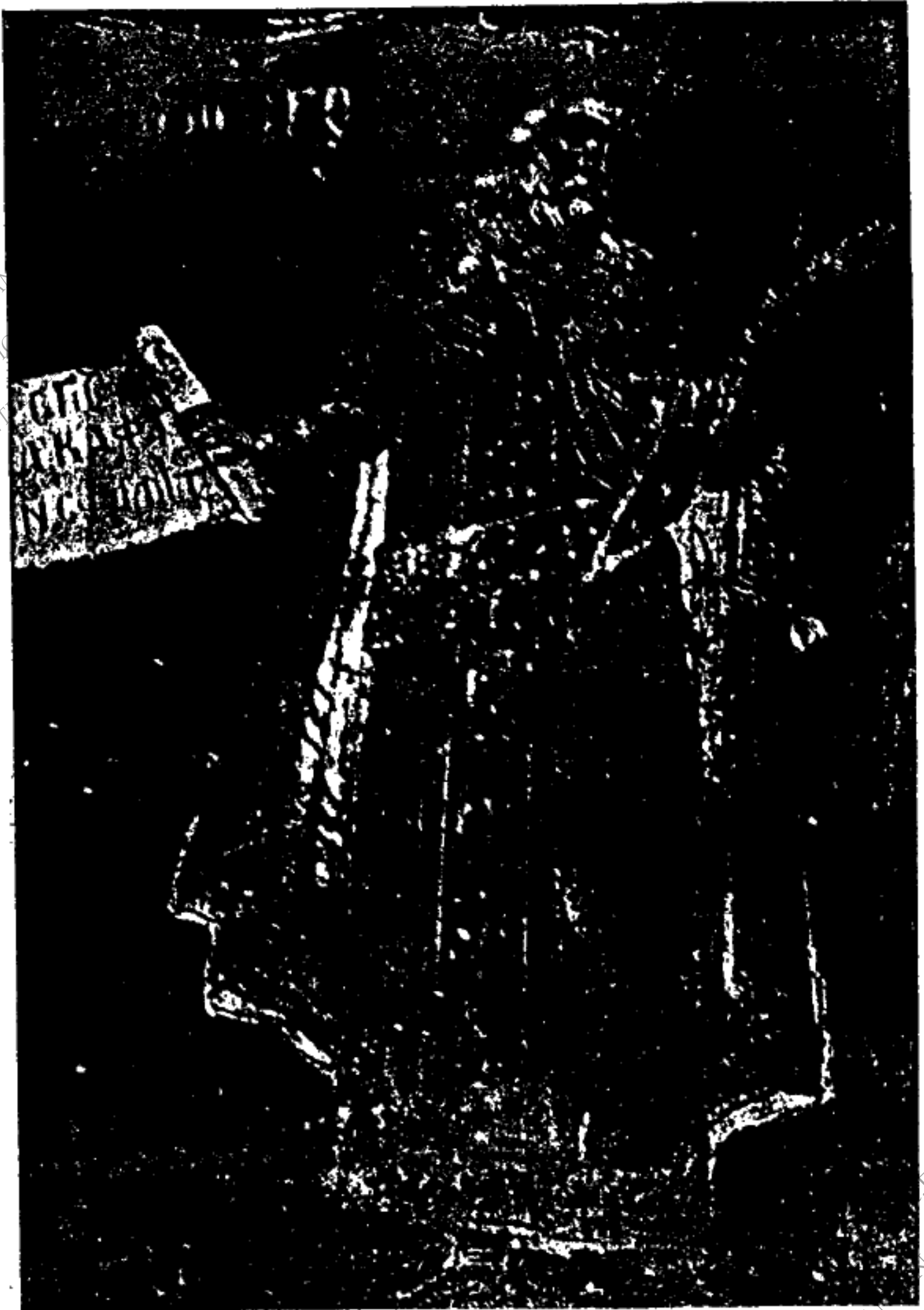
Εικ. 7. - *Όμηρος.