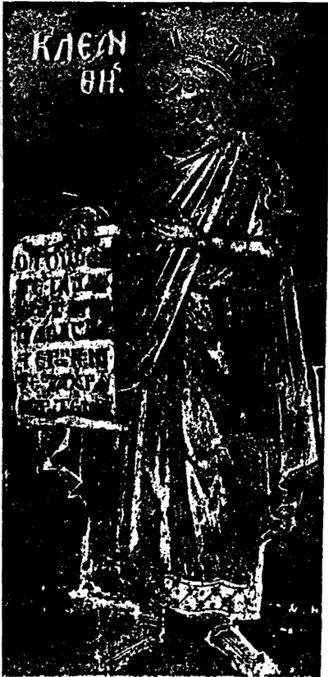
Εἰκ. 5. - Κλεάνθης.