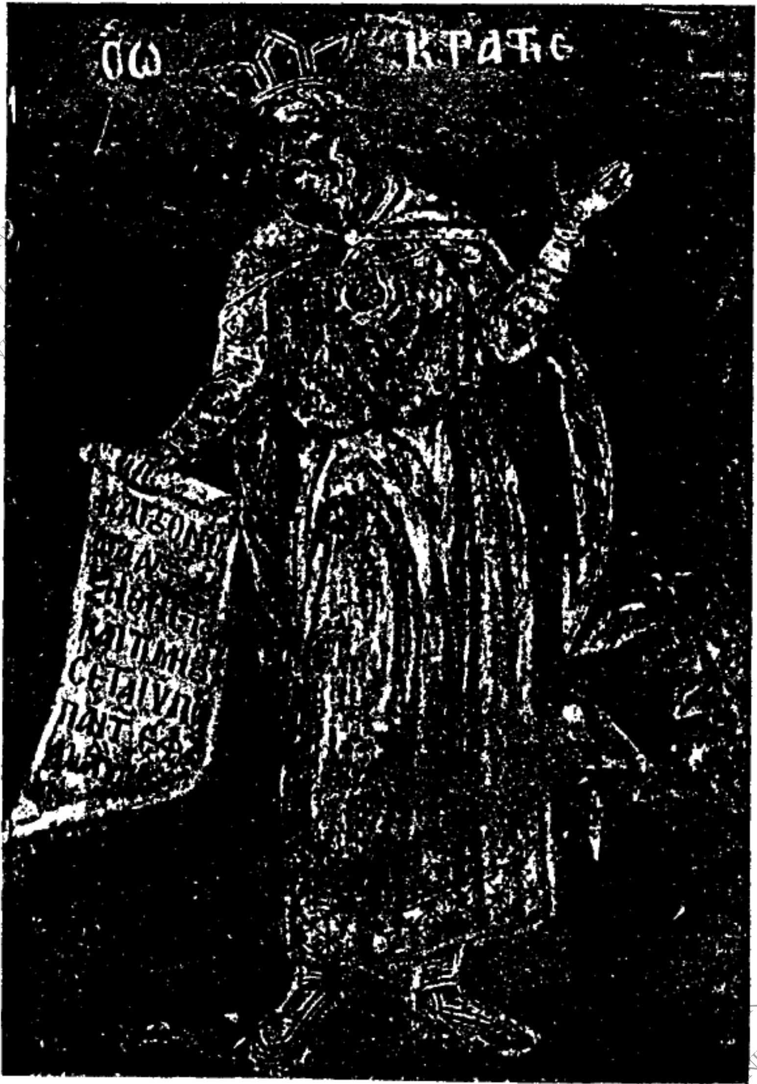
Εἰκ. 1. - Σωκράτης.