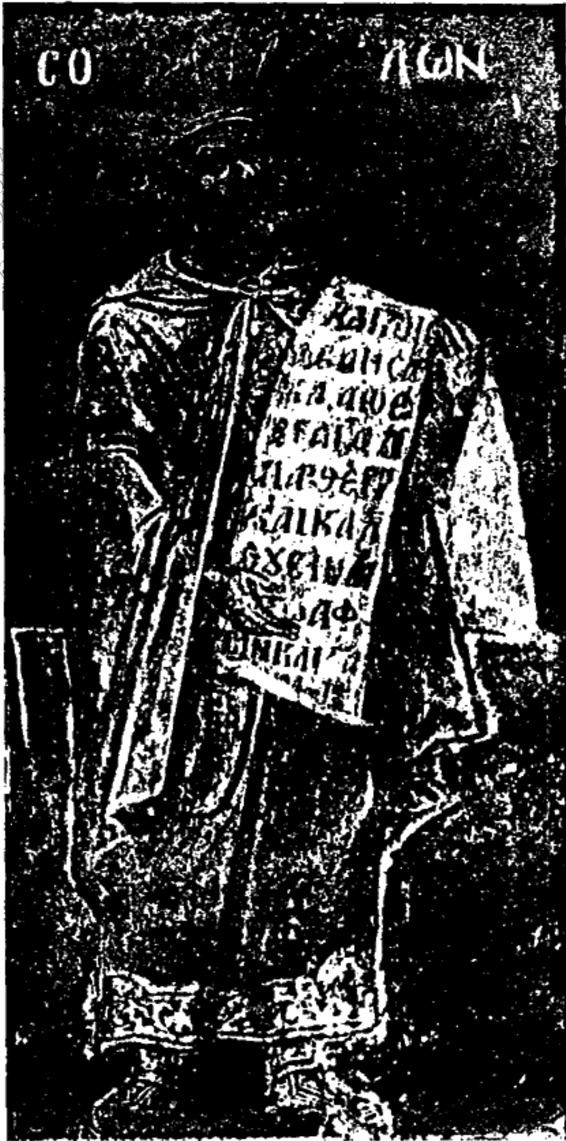
Εικ. 4. - Σόλων.

ΠΑΝΕΠΙΣΤΗΜΙΟ ΙΩΑΝΝΙΝΩΝ ΤΟΜΕΑΣ ΦΙΛΟΣΟΦΙΑΣ ΕΡΓΑΣΤΗΡΙΟ ΕΡΕΥΝΩΝ ΝΕΟΕΛΛΗΝΙΚΗΣ ΔΙΕΥΘΥΝΤΗΣ: ΕΠ. ΚΑΘΗΓΗΤΗΣ