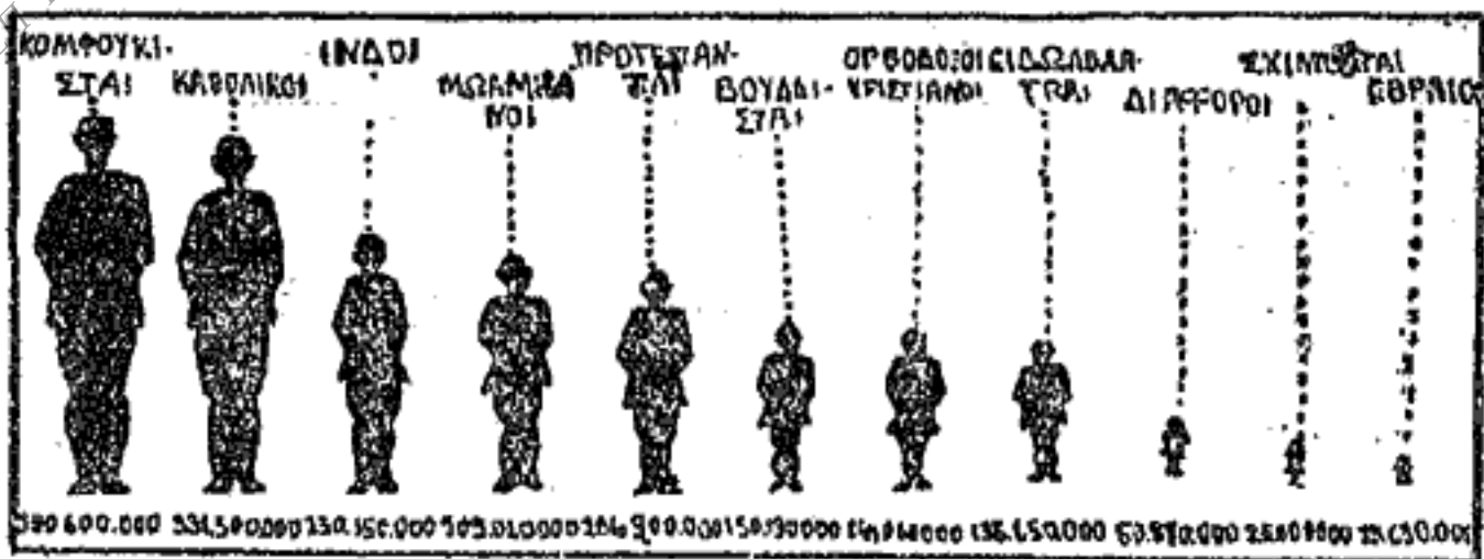
Εἰκ. 3 ΚΑΤΑΝΟΜΗ ΤΟΥ ΠΛΗΘΥΣΜΟΥ ΤΗΣ ΓΗΣ ΚΑΤΑ ΘΡΗΣΚΕΥΜΑΤΑ

Εἶναι δὲ ὁ ὅλος πληθυσμὸς τῆς Γῆς κατανεμημένος εἰς τὰς ἑξῆς θρησκείας : 350.600.000 εἶναι κομφουκισταί, 331.500.000 εἶναι Ρωμαιοκαθολικοί, 230.150.000 εἶναι Ἰνδικοῦ θρησκευάματος, 209.020.000 εἶναι Μωαμεθανοί, 206.900.000 εἶναι Προτεστάνται, 150.180.000 εἶναι Βουδισταί, 144.000.000 εἶναι ὀρθόδοξοι, 135.650.000 εἶναι ζωολάτραι, 15.630.000 εἶναι Ἑβραῖοι καὶ 75.870.000 εἶναι διαφόρων θρησκευμάτων.