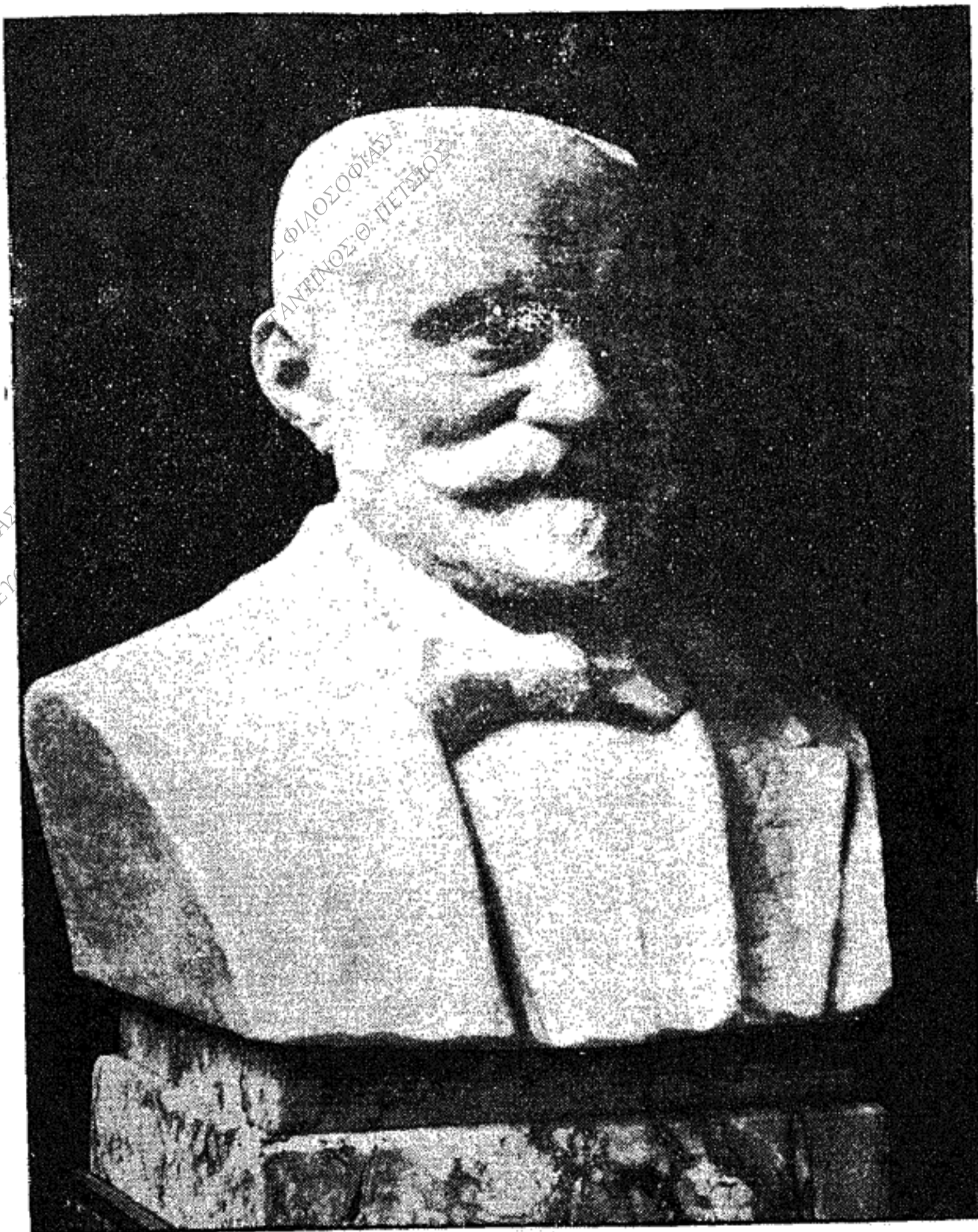
ΠΡΟΤΟΜΗ ΜΑΡΓΑΡΙΤΟΥ ΕΥΑΓΓΕΛΙΔΟΥ