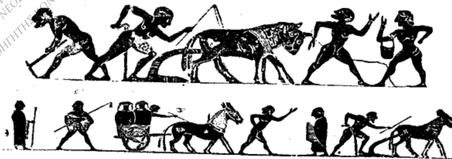
Σκηναὶ ἀπὸ τὴν ζωὴν τῶν γεωργῶν παραστάσεις ἐπὶ ἀγγείων

Μετὰ τὸν θάνατόν του ἐκυβέρνησεν ὁ μεγαλύτερος υἱὸς του Ἰππίας. Ἀλλὰ τὰ παιδιὰ τοῦ Πεισιστράτου δὲν εἶχαν τὴν ἱκανότητά του καὶ δυσηρέστησαν πολλοὺς. Ὁ υἱὸς του Ἰππάρχος προσέβαλεν ἕνα εὐγενῆ νέον, τὸν Ἀρμόδιον, ὁ ὁποῖος τὸν ἐδολοφόνησε μὲ τὸν φίλον του Ἀριστογείτονα κατὰ τὴν ἐορτὴν τῶν Παναθηναίων. Ἀπὸ τότε ὁ Ἰππίας ἔγινε πολὺ κα-