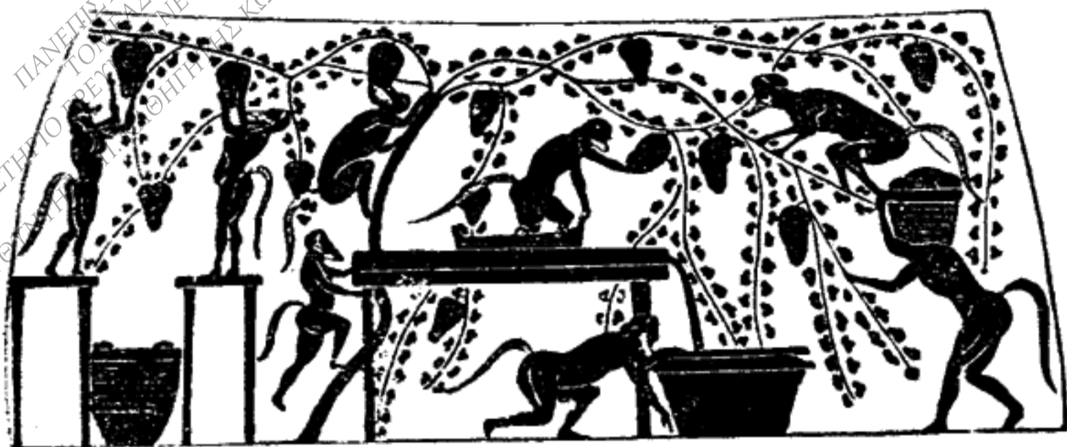
Τρύγος, παράστασις ἐπὶ ἀγγείου

Ὁ Κλεισθένης κατήργησε τὴν διαίρεσιν τῶν κατοίκων εἰς τάξεις μετὰ τὴν περιουσίαν. Τὰ χωρία τῆς Ἀττικῆς καὶ τὰς συνοικίας τῆς πόλεως ἐχώρισεν εἰς 100 κοινότητες, τοὺς λεγομένους δήμους. Τοὺς δήμους πάλιν τοὺς ἐχώρισεν εἰς 10 διοικητικὰς περιφερείας, τὰς λεγομένας δέκα φυλάς. Ἐκάστη φυλὴ λοιπὸν περιλαμβάνει δέκα δήμους. Ἐφρόντισεν ὅμως ἡ φυλὴ νὰ μὴ περιλάβῃ δήμους μιᾶς μόνον περιφερείας, ἀλλὰ ὅσον τὸ δυνατόν μεγαλυτέραν ποικιλίαν, δηλαδὴ δήμους μεσο-