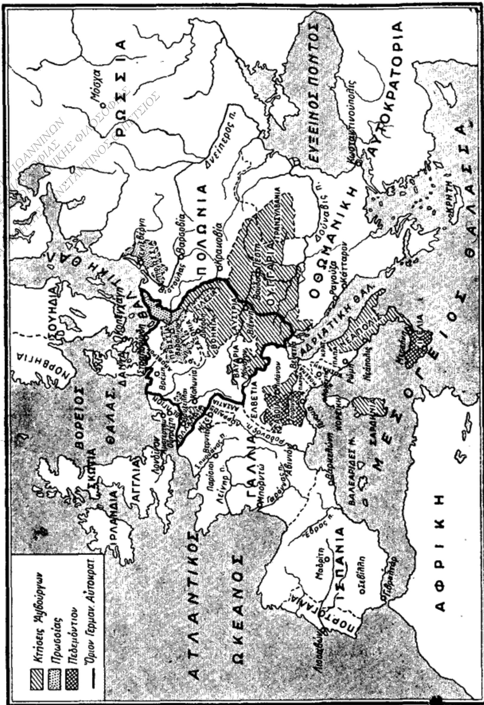
Ἡ Εὐρώπη μετὰ τὴν εἰρήνην τῆς Οὐτρέχτης (1713).

ΠΑΝΕΠΙΣΤΗΜΙΟ ΙΟΑΝΝΙΝΩΝ ΤΟΜΕΑΣ ΦΙΛΟΣΟΦΙΑΣ ΚΑΤΗΓΟΡΙΑ ΠΡΩΤΗΣ ΜΕΤΑΠΤΥΧΙΑΚΗΣ ΦΙΛΟΣΟΦΙΑΣ ΔΙΕΥΘΥΝΤΗΣ: ΕΠ. ΚΑΘ. ΠΑΡΑΣΚΕΥΗΣ ΑΝΣΤΑΤΙΝΟΥΣ (ΕΠΙΤΥΧΙΟΣ)