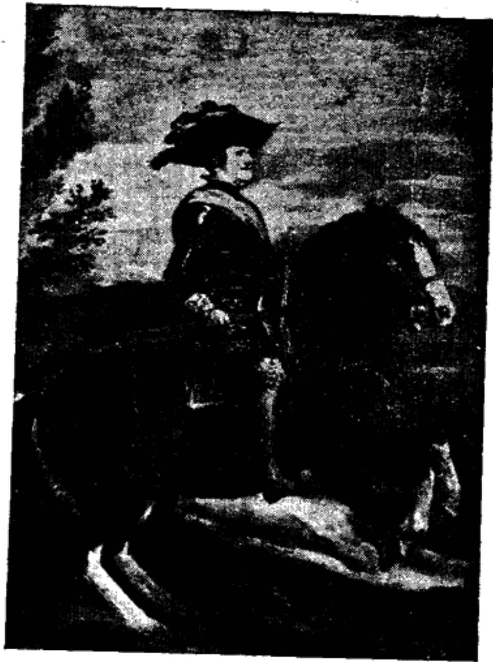
Φίλιππος Δ΄ Ἰσπανίας (Βελασκέξ).

Ὁ Μουρίλλο (Mou- rillo, 1617 - 1682) ἐζωγράφιζε σκηνὰς ἀπὸ τὴν ἱερὰν ἱστορίαν ἐπὶ τῶν τοίχων τῶν μοναστη-