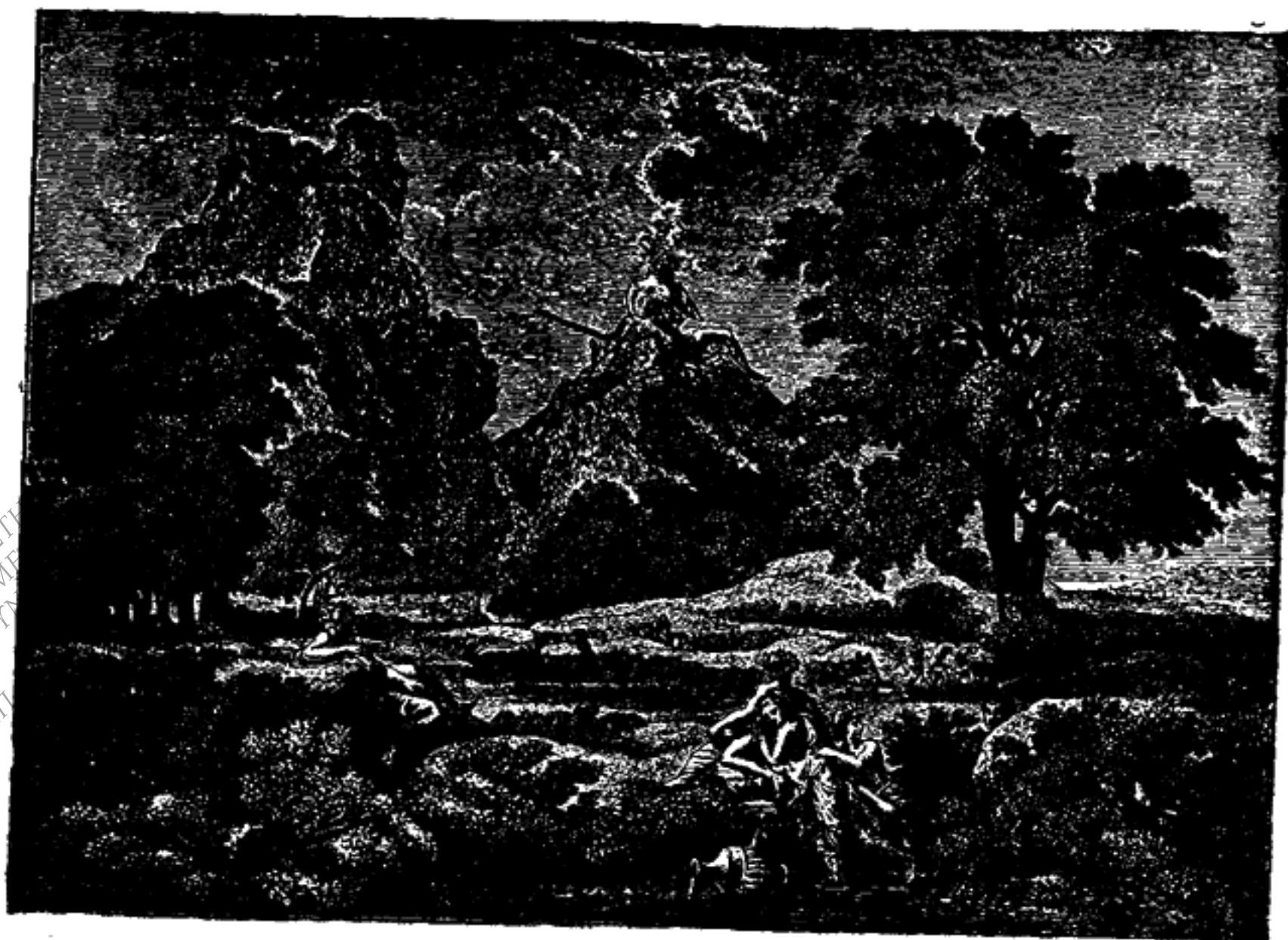
Ἡρωικὸν τοπίον (Πουσέν).