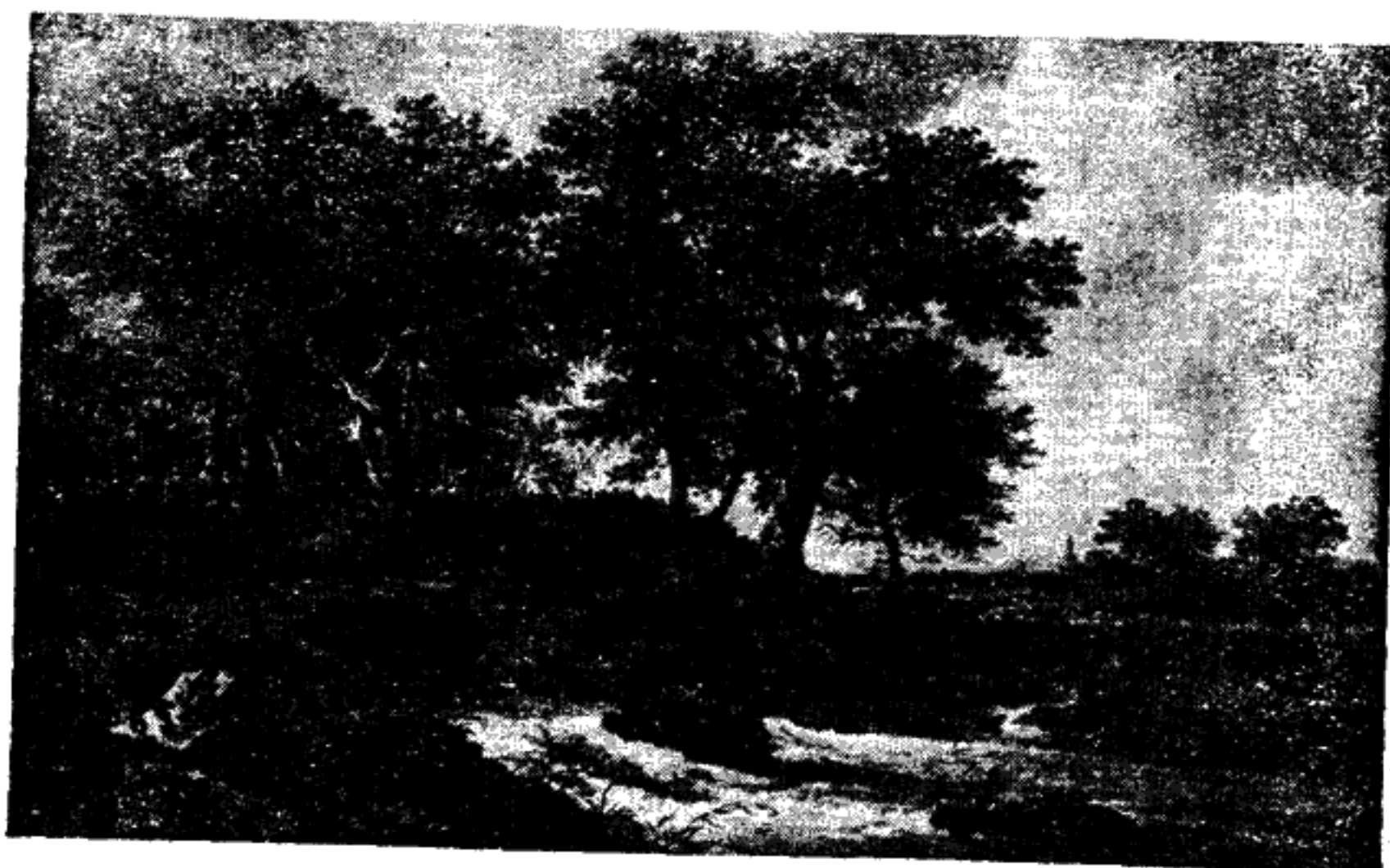
Ὁ ρύαξ (Ρουϊσοντάελ).