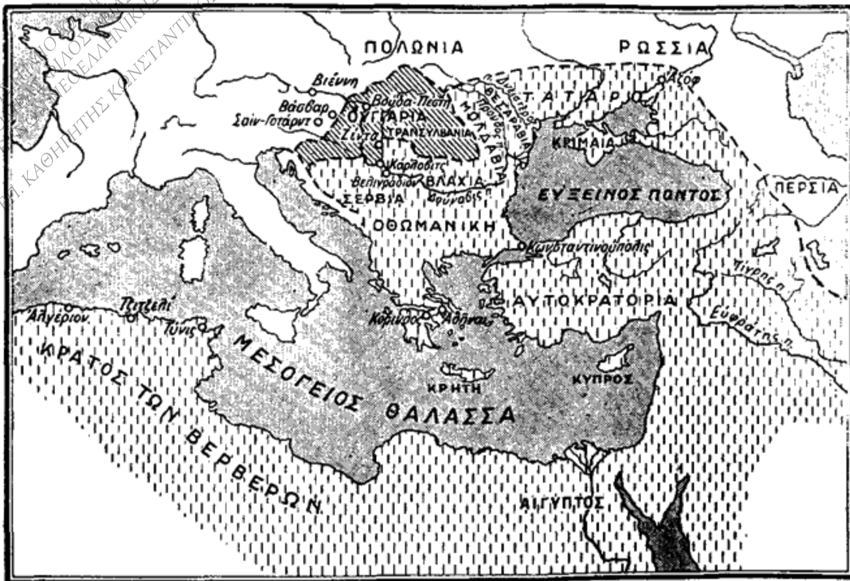
Ἡ Τουρκία τὸν 17ον αἰῶνα.

Μετὰ τοὺς μεγάλους σουλτάνους τοῦ 16ου αἰῶνος, τὸν Σελὶμ Α' καὶ τὸν Σουλεῦμάν Β', αἱ κατακτήσεις τῶν Τούρκων κατ' οὐσίαν ἔστα-