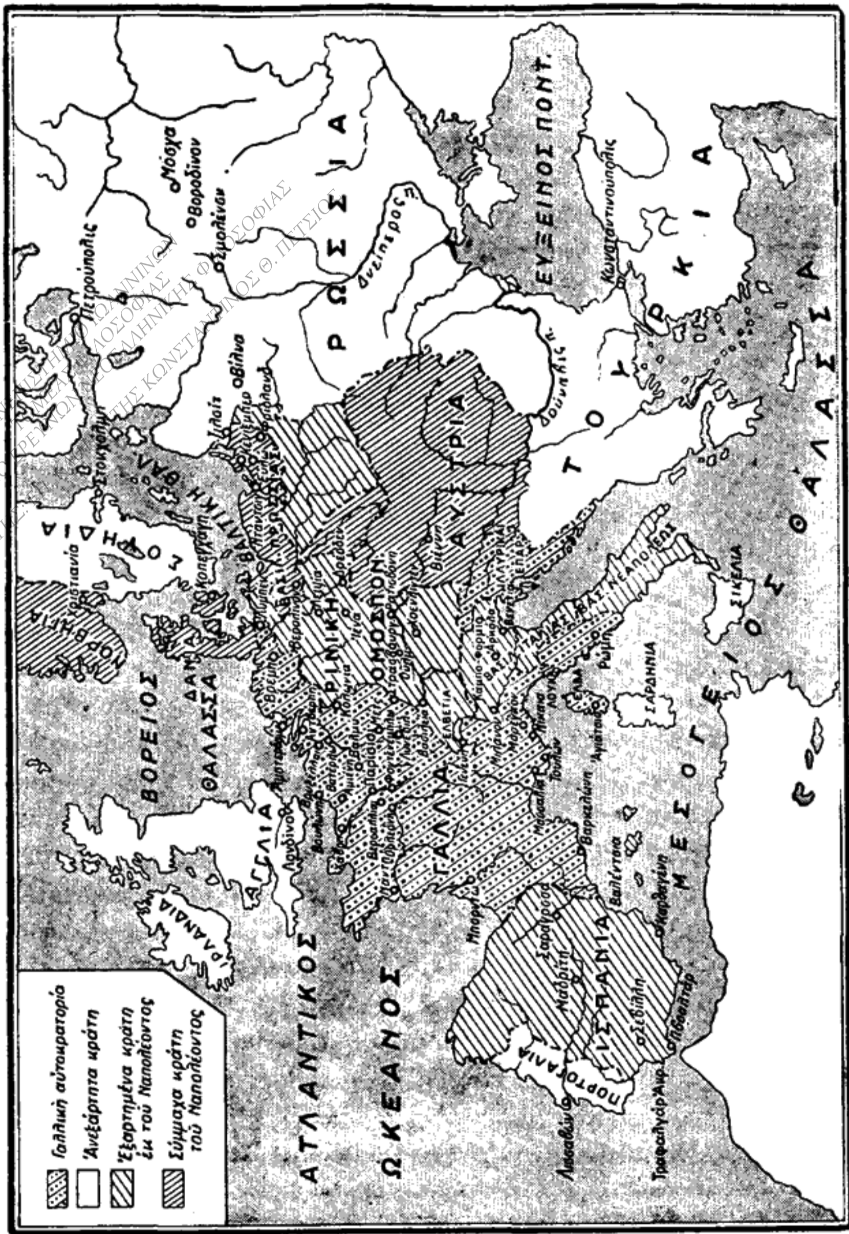
‘Η Εὐρώπη κατά τὸ 1812.