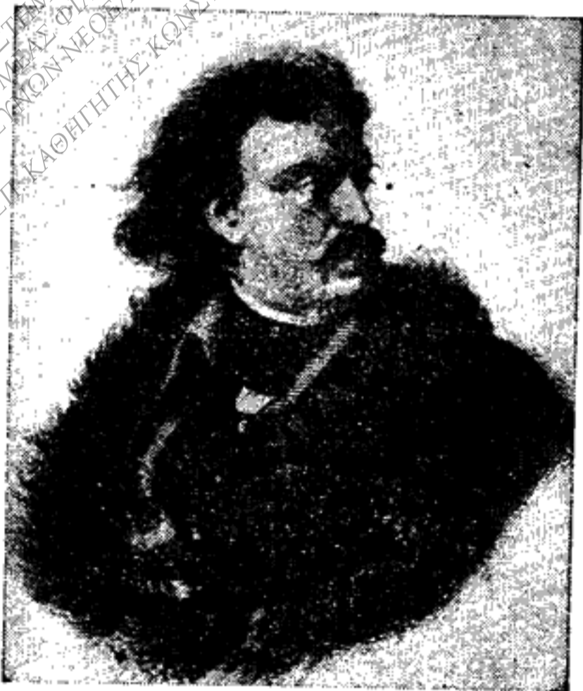
Ὁ Μέγας Πέτρος.

Ἐταξίδευσεν ὕστερον εἰς τὴν Εὐρώπην, διὰ νὰ διδαχθῇ τὴν εὐ- ρωπαϊκὴν τέχνην. Ἐπέρασεν ἀπὸ τὴν Πρωσσίαν καὶ ἔφθασεν εἰς τὴν Ὀλλανδίαν, ὅπου εἰργάσθη ὡς ἀπλοῦς ἐργάτης ὑπὸ τὸ ὄνομα Πέ-