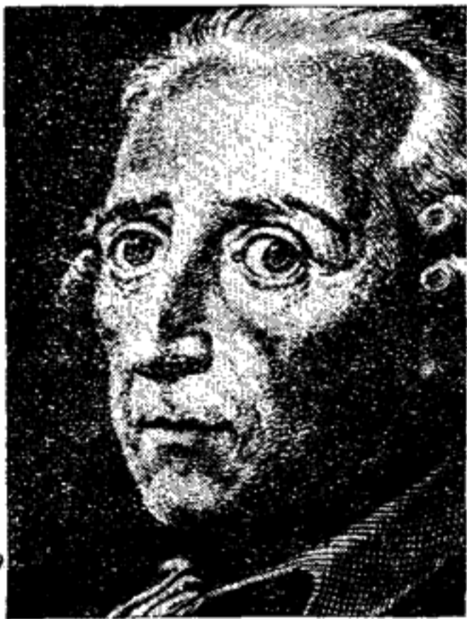
Φρειδερίκος ὁ Μέγας.

Τὴν δύναμιν αὐτὴν μετεχειρίσθη ὁ υἱὸς του Φρειδερίκος ὁ Β', διὰ νὰ ἐπεκτείνῃ τὸ κράτος του καὶ νὰ καταστήσῃ τὴν Πρωσσίαν μεγάλην δύναμιν.