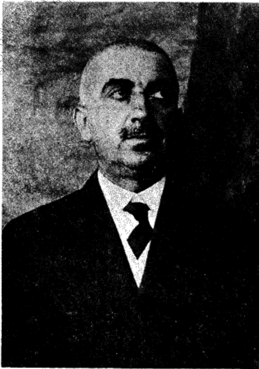
Ο ΒΛΑΧΟΓΙΑΝΝΗΣ ΣΤΑ 1912

καταγωγής του τήν είχε ζήσει βαθύτατα. Για τό Βλαχογιάννη ό άρχικός ποιητικός πυρήνας ύπάρχει στη φυσική αντικειμενικότητα. Η αντικειμενική θεώρηση τών φυσικών δεδομένων ήταν ή πρώτη πηγή τών έμπνεύσεων του. Δέν έχει όμως γι' αυτόν ή έννοια του αντικειμενικά δεδομένου τήν άποκλειστικότητα που θά ήθελε νά του προσδώσει ένας μονόπλευρος φυσιοκρατισμός. Δεδομένο αντικειμενικό είναι για τό Βλαχογιάννη εκτός άπό τή φυσική και τήν ψυχολογική πραγματικότητα, άκόμη και τό παραμύθι.