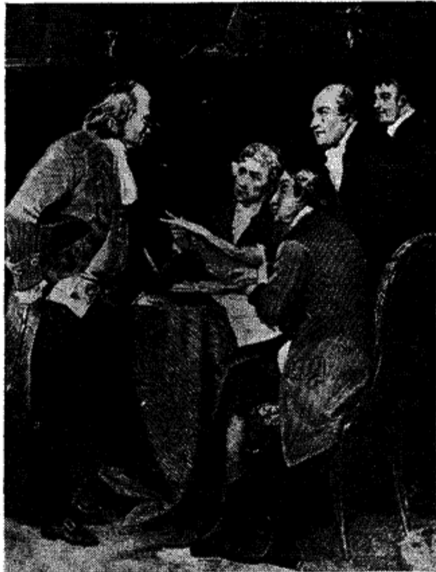
'Η έπιτροπή που συνέταξε ή Διακήρυξη 'Ανεξαρτησίας των 'Ηνωμένων Πολιτειών (από άριστερά: Φραγκλίνος, Τζέφφερσον, 'Αδαμς, Λίβιγκστον, Σέρμαν).

Σήμερα αποτελείται ή 'Ομοσπονδία από 48 πολιτείες. Έκτος από τις 13 πρώτες,