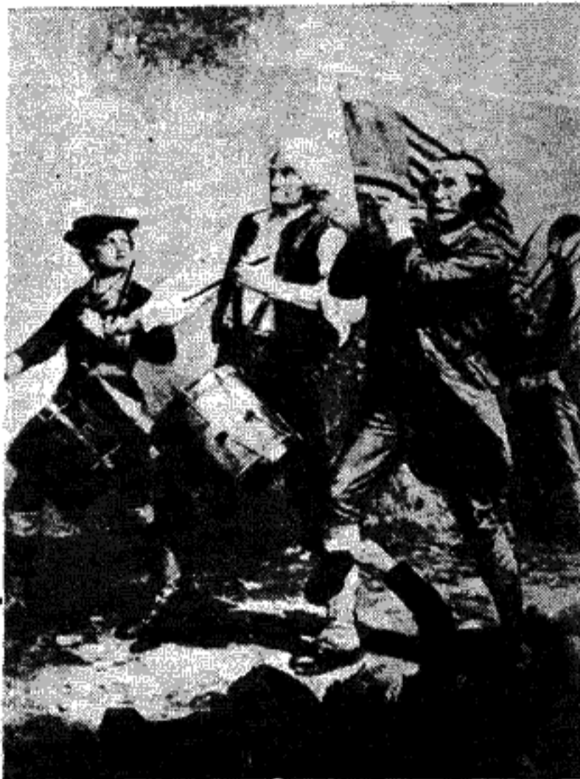
Ρακένδυτοι και με φτωχόν όπλισμό άρχίζουν οι άμερικάνοι τό 1776 τόν άπελευθερωτικό τους άγώνα.

“Ο άλύγιστος πουριτανισμός τών πρώτων χρόνων αποτέλεσε τόν μεγάλο καθοδηγητή και εκπαιδευτή του αμερικανού αποίκου. Οι πρώτες οίκογένειες τών αποίκων για να πάρουν τή δύσκολη απόφαση να διαβούν τόν ωκεανό, όταν γλύτωναν από τήν θαλάσσιαν άβυσσο και τίς άρρώστιες τών πολύμηνων ταξιδιών και φθάναν μετά τρεις ή τέσσερις μήνες σε μιάν έρημη χώρα άνεξερεύνητη, άκαλλιέργητη, παρθένα, που ούτε όνομα δέν είχε, ούτε θέση καλά - καλά στους χάρτες, χρειαζόνταν έκτός από τό θρησκευτικό φανατισμό, και θάρρος, αποφασιστικότητα, σιδερένια θέληση και σκληρότητα άπέναντι του έαυτου σου και τών δικών σου και μαχητικότητα. “Έπρεπε από τό πρώτο σανίδι τής πρώτης καλύδας όλα να γίνουν έξ άρχής. “Έλειπαν λογιών τεχνίτες, έλειπαν γιατροί. Και έν τούτοις έπρεπε και έργαλεία να γίνουν και παιδιά να γεννηθούν. Για ό,τι χρειαζότανε θα έπρεπε να περιμένουν σχεδόν ένα χρόνο και περισσότερο να τους έλθη από τήν Εύρώπη. Με ύπομονή και έπιμονή ώργάνωναν σιγά - σιγά έναν άσκητικό τρόπο ζωής. Σε όλην αυτήν τήν δοκιμασία