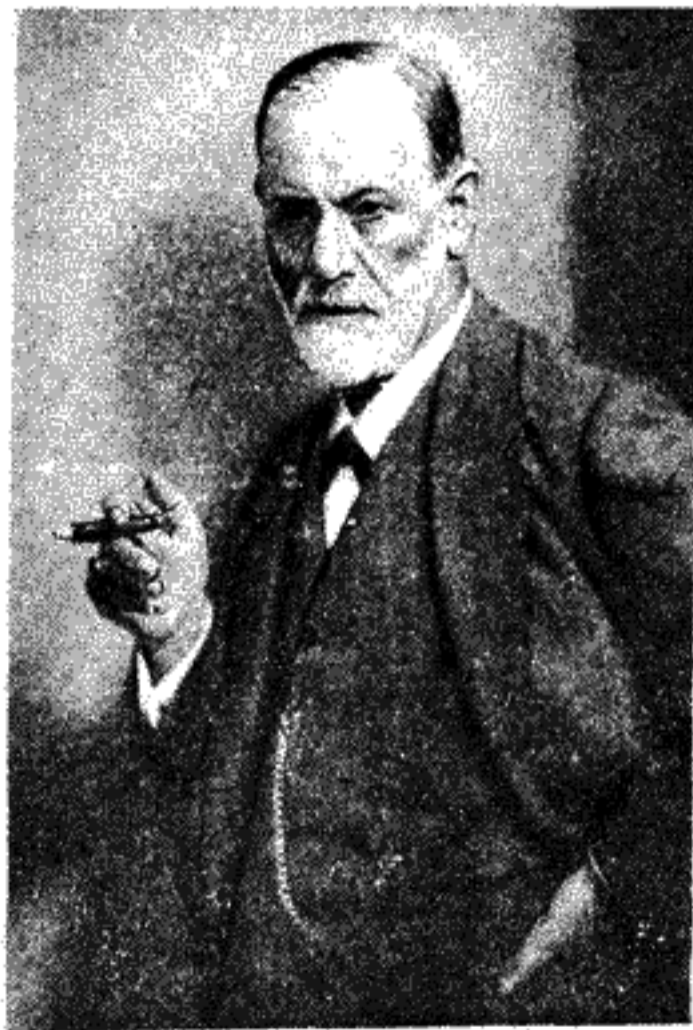
Ὁ Φρόυντ στὸ μεσουράνημά του. (φωτογρ. τοῦ 1922, σὲ ἡλικία 66 χρονῶν)

Στὴν ἴδια περίοδο ἀνήκει ἐπίσης καὶ ὁ διαχωρισμὸς τῆς ψυχικῆς δόμησης σὲ τρεῖς μονάδες: Τὸ Ἐγὼ (λογικὸ), τὸ Ὑπερεγὼ (ἠθικὸ) καὶ τὸ Ἐκείνο (ἐνστικτικὸ).