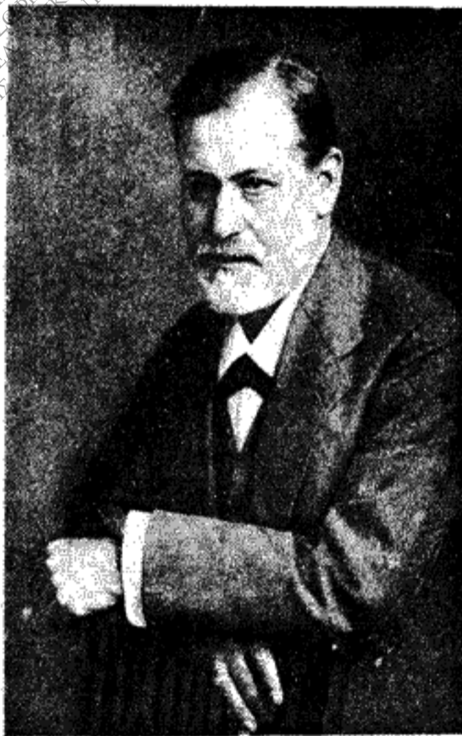
Ὁ Φρόυντ στὸ ξεκίνημα τῆς ψυχανάλυσης, (Φωτογρ. τοῦ 1909, σὲ ἡλικία 53 χρονῶν)

μ' ἐπικεφαλῆς τὸν Ἄντλερ ἀπεσύρθηκαν σὲ μιὰ ἰδιαίτερη συνεδρίαση γιὰ ν' ἀντιδράσουν. Ὁ Φρόυντ παρουσιάστηκε ξαφνικὰ στὴ συγκέντρωση τῶν βιεννέζων καὶ τοὺς κατηγοροῦσε γιὰ μικροζηλότυπους καὶ μικροφιλόδοξους. Ἄν εἶχαν περισσότερη διορατικὴ δύναμη, τοὺς εἶπε, θὰ πρεπε νὰ δοῦν ὅτι τὸ νὰ τεθῆ ἓνας ξένος ἐπὶ κεφαλῆς θὰ ἐξουδετέρωνε τὶς διώξεις ποὺ εἶχαν στὸν τόπο τους καὶ θὰ ἐδραίωνε τὸ κύρος τῆς ψυχανάλυσης. Στὸ τέλος ἐπικράτησαν λύσεις συμβιβαστικῆς. Ἡ ὀνομασία τοῦ Γιούγκ στὴν προεδρία τῆς διεθνοῦς ἐταιρίας ὀρίστηκε γιὰ δύο χρόνια ἐνῶ παράλληλα ὁ Ἄντλερ, ὁ ἀρχαιότερος καὶ ὁ μαχητικότερος ἀπὸ τοὺς βιεννέζους μαθητὲς τοῦ Φρόυντ, ὀνομάσθηκε πρόεδρος τῆς Ψυχαναλυτικῆς Ἐταιρίας