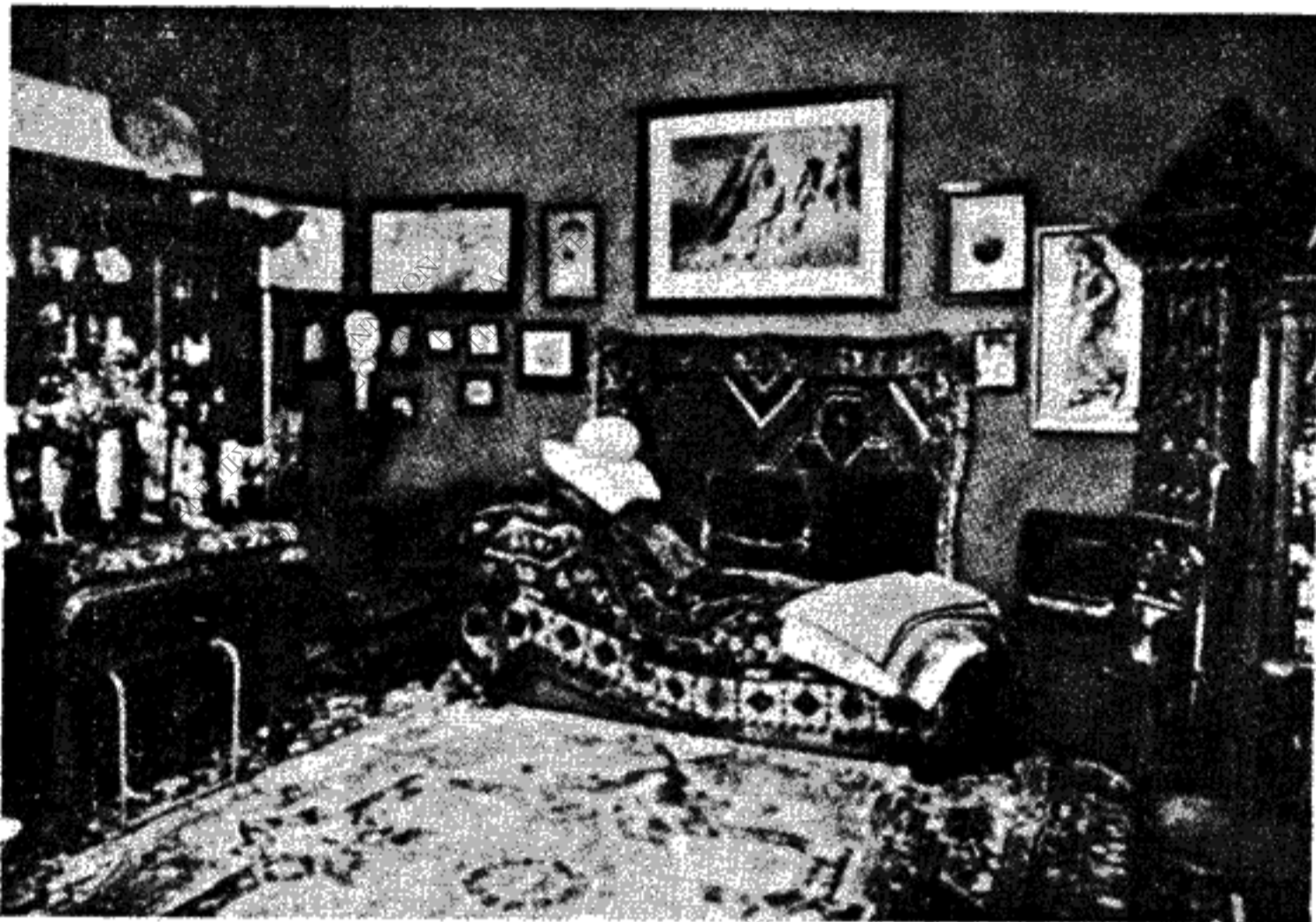
Το γραφείο του Φρόυντ με το πρώτο ψυχαναλυτικό ντιβάνι.

δεύτερο δάχτυλο του δεξιού χεριού και το πούρο πάντα αναμένο και προπαντός με το σκληρό και διεισδυτικό βλέμμα του, δεν έδειχνε καθόλου κουρασμένος κι' ως εξακολουθούσε να εργάζεται ακατάπαυστα στο ιστορικό διαμέρισμα του σπιτιού της Μπέργκκασσε αρ. 19 όπου έκυλησε η ζωή του επί 50 περίπου χρόνια (1891 - 1938) μέσα στα τρία άτομικά του δωμάτια γεμάτα από ράφια με βιβλία, στολισμένα με μάσκες τοτεμικές και φετιχ και πρωτόγονα κομψοτεχνήματα Ιθαγενών της Ασίας και της Αφρικής και βυθισμένα σ' ένα μυστηριακό κι' υποβλητικό μισόφωτο. Στο βάθος ήταν το τζάκι και πλευρικά το γραφείο του όπου χιλιάδες άθανατες σελίδες γράφτηκαν σ' ατέλειωτα ξενύχτια. Στο άλλο πλάι η πολυθρόνα και το διβάνι της ψυχανάλυσης όπου εκατό περίπου χιλιάδες θεραπευτικές συνεδρίες είχαν γίνει, με τον Φρόυντ σκυμένο επάνω στην έρευνα της ψυχής