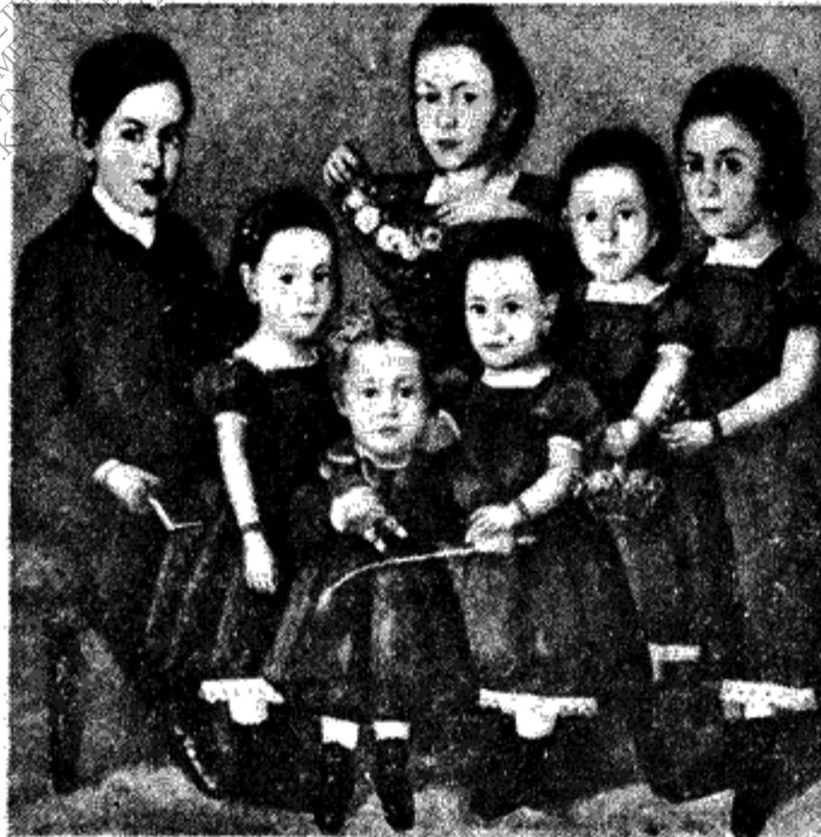
Ο Σίγκμουντ Φρόυντ (άριστερά) μαζί με τ' αδέλφια του. Η ψηλότερη είναι η πρώτη αδελφή του Άννα.

στροφία και την όμιλητική του ευχέρεια, σπουδάζοντας νομικά. Η μελέτη όμως της θεωρίας του Ντάρβιν κι' ένα δοκίμιο του Γκαίτε για τα φυσικά φαινόμενα, του γέννησαν ξαφνικά το ένδιαφέρον για την Ιατρική. Ο πατέρας του τον άφησε έλεύθερο στην έκλογή του κι' έτσι γράφτηκε στην Ιατρική σχολή του Πανεπιστημίου της Βιέννης το 1873, σε ηλικία 17 έτων. Στην άρχή έδειξε ένα ιδιαίτερο ένδιαφέρον για τη Φυσιολογία και άργότερα για την ανα-