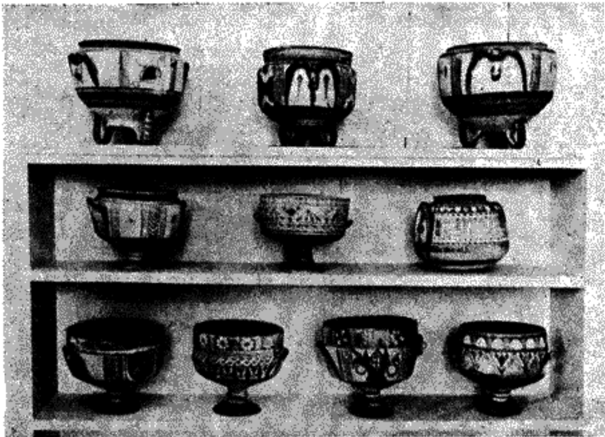
Ἄγγεια γεωμετρικῆς ἐποχῆς 6000 π. Χ. — Συλλογὴ Πιερίδου.