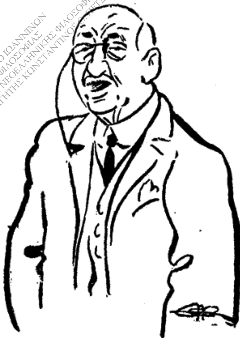
Ὁ Ψυχάρης σὲ μιὰν ἀπὸ τὶς διαλέξεις ποὺ ἔδωσε ὅταν ἦρθε τὸ 1925 γιὰ τελευταία φορὰ στὴν Ἀθήνα. (Σκίτσο Ν. Καστανάκη)

κὸς Εὐρωπαῖος καθηγητὴς τῆς πρὶν ἀπὸ τὰ 1914 ἐποχῆς. Τὸ ἔλεγε καὶ μόνος του πὼς δὲν εἶταν κι οὔτε ἤθελε νὰ χαρακτηρίζεται ἐπαναστάτης. Ὡς ἐπαναστάτες, μὲ τὴν κακὴν ἔννοια, θεωροῦσε, ἴσια-ἴσια, τοὺς φανατικούς του ἀντιπάλους, τοὺς καθαρουσιάνους φιλολόγους κι ἐκπαιδευτικούς ποὺ θέλησαν νὰ καταλύσουν τὴ μόνη γνήσια ἐθνικὴ μας παράδοση, τὴν παράδοση τοῦ Θρήνου τῆς Πόλης, τοῦ Δημοτικοῦ Τραγουδιοῦ, τοῦ Ἐρωτόκριτου, τῆς Κλεφτουριάς. Αὐτὴν τὴν παράδοση ζητοῦσε, καθὼς ἔλεγε, νὰ ἀποκαταστήσει, γκρεμίζοντας τὰ κούφια σύμβολα καὶ τὴν ψεύτικη γλῶσσα, γιὰ νὰ ξαναβρεῖ τὸ ἔθνος τὶς ρίζες του καὶ τὴ συνείδηση τοῦ ἀληθινοῦ ἑαυτοῦ του. Εἶταν ἄνθρωπος τῆς Μεγάλης Ἰδέας, μιλοῦσε γιὰ τὸ Μαρμαρωμένο Βασιλιά καὶ γιὰ τὰ προαιώνια δειρά τοῦ Γένους μὲ φωνὴ παθιασμένη κι ἀστραπὲς στὰ μάτια. Οἱ γνῶμες του ἐκφράζαν ἕναν ἀδι-ἀλλάκτο ἐθνικισμό, συγκροτημένο θεωρητικὰ, ζωντανὸ καὶ ἀπόλυτα εἰλικρινὴ, ποὺ μᾶς φάνηκε ὡστόσο, στὸ ἰδεολογικὸ κλίμα τοῦ 1925, κάπως στενὸς καὶ ξεπερασμένος. Μᾶς εἶ-