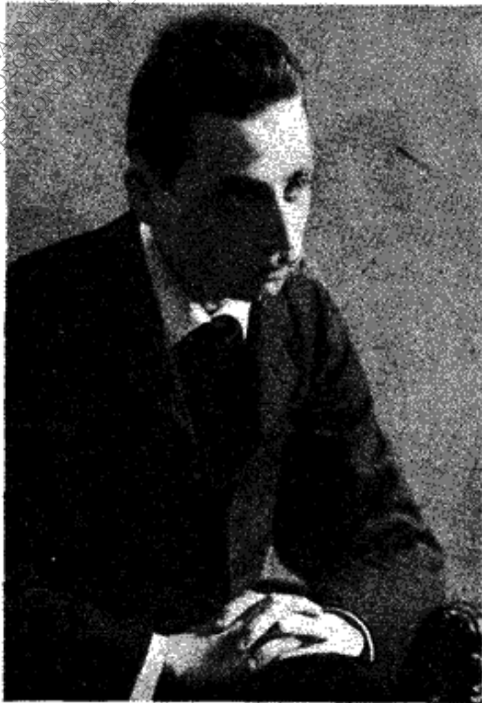
ΡΑΪΝΕΡ ΜΑΡΙΑ ΡΙΛΚΕ

Γι' αυτό και στο «Βιβλίο των Ώρων» μιλώντας για τα πράγματα, λέει πώς μέσα τους βρίσκει το Θεό να λιάζεται σά σπόρος στα μικρά και να μάς δίνεται μεγάλος στα μεγάλα. (Τα πράγματα έχουν μια δική τους Ιεραρχία: αρχίζει από την πέ-