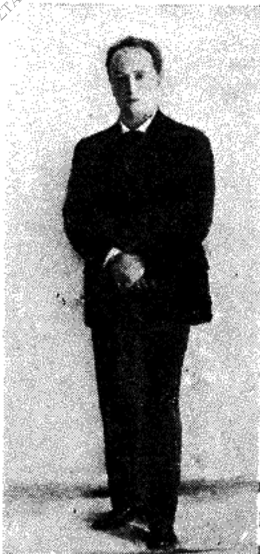
ΑΓΓΕΛΟΣ ΣΙΚΕΛΙΑΝΟΣ (Φωτογραφία τοῦ 1915)

τὴν πανίδα καὶ τὴν ἀνόργανη, μὰ κυ- ρίως μὲ τὸ φυσικὸ φαινόμενο—τὸν πλουτί- ζει μὲ τὴ λεπτομερειακὴ παρατήρηση καὶ μὲ τὴν ἀπέραντη γνώση πού προμηθεύουν τὸ ἀνεξάντλητο ὕλικὸ τῶν εἰκόνων του. Μὰ ἴ- σως ἢ ἔκφρασή μου δὲν εἶναι σωστὴ. Οἱ ἀ- πειρες εἰκόνες πού ἀποτελοῦν τὸ μεγαλύ- τερο μέρος τῆς Σικελιανικῆς ποίησης, δὲν εἶναι ἀπλὲς διακοσμητικὲς παρομοιώσεις καρπὸς «φιλολογικῆς» ἐπιδίωξης. Ὁ Σικε- λιανὸς θαρρεῖ καὶ δὲ μπορεῖ νὰ ἔκφρασε μὰ οὐδέ καν νὰ σκεφτεῖ παρὰ μόνον ἀνάμε- σα ἀπὸ ζωντανές, λαχταριστὲς εἰκόνες. Συ- χνὰ θέτει κάτι γιὰ νὰ τὸ ἄρει εὐθύς ἀμέσως