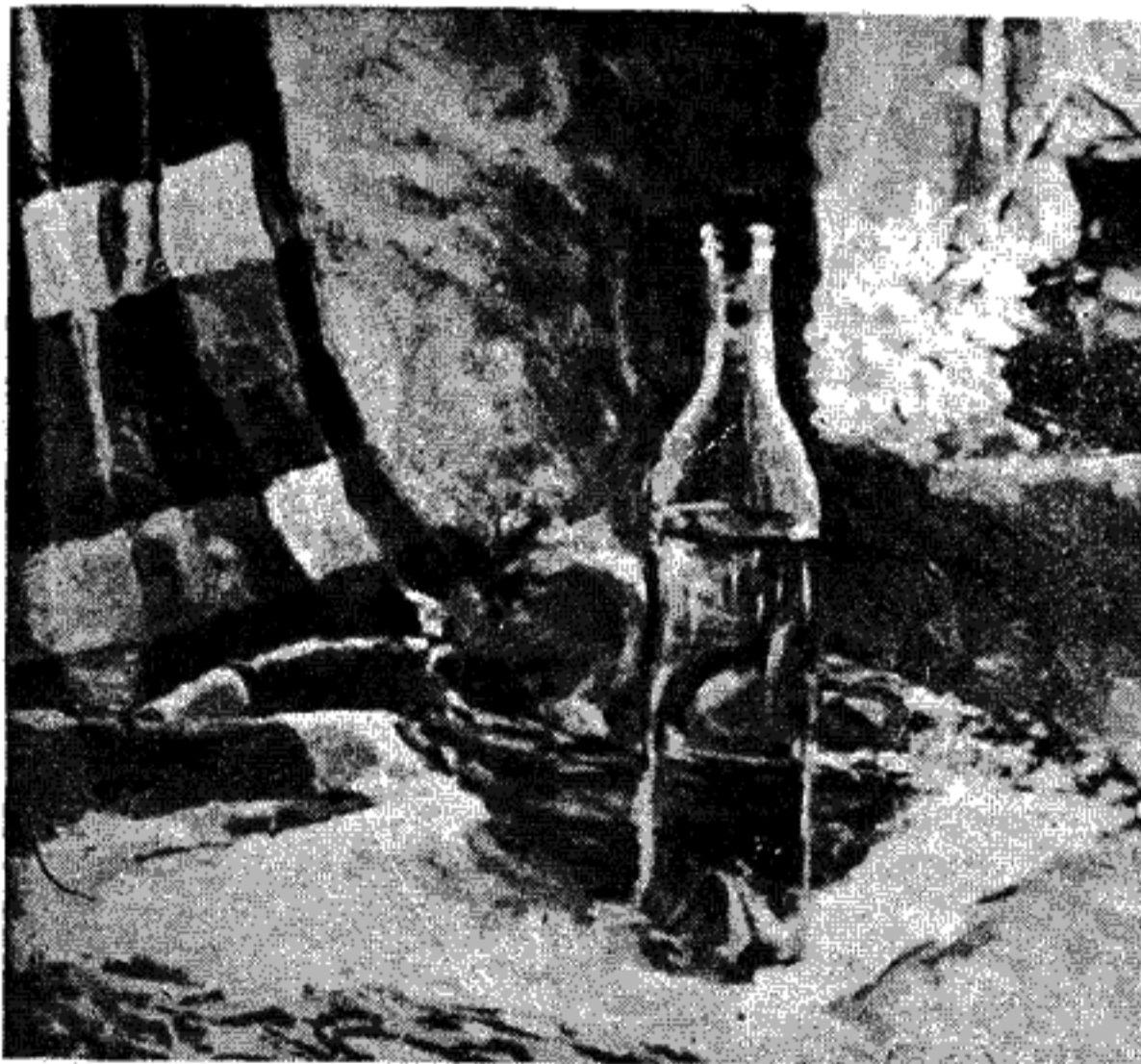
ΓΕΩΡΓΙΑ ΤΕΡΛΙΔΟΥ - ΓΙΑΝΝΟΠΟΥΛΟΥ