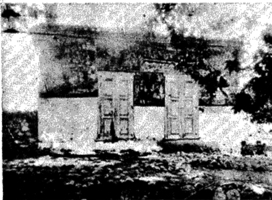
Τὸ μικρὸ καφενίον τῆς Καρίνης, ἐξοχικῆς τοποθεσίας τῆς Μυτιλήνης, ποὺ οἱ τοῖχοι του εἶναι διακοσμημένοι μὲ τοιχογραφίες τοῦ Θεόφιλου.

μένα τουλάχιστο, ὁ Θεόφιλος δὲν εἶναι ἕνας «καλλιτέχνης» (μὲ τὴν ἔννοια καὶ τὸ περιεχόμενον ποὺ δίνουμε στὴ λέξη) ὁ ὁποῖος πῆτε ἔχει ν' ἀποδώσει τὴν ἑλληνικὴ ζωὴ καὶ φύση μ' ἕνα τρόπο ποὺ νὰ μᾶς δίνει τὴν ψευδαἴσθησιν τῆς μετάστασής τους μέσα στοὺς πίνακές του. Δὲν ὑπάρχει, δὲν βλέπω σ' αὐτόν, τίποτα τὸ συνειδητό, τὸ ἠθελημένο, τὸ «ὑπεύθυνο», ὅπως θάλεγε ὁ Σικελιανός. Κανένα truc, καμμία μαεστρία. Ἡ ζωγραφικὴ τοῦ Θεόφιλου εἶναι ζωγραφικὴ ἑνὸς μέντιουμ, ὅπως πολὺ σωστά, πολὺ χαρακτηριστικὰ τὸν ἀπεκάλεσε ὁ γάλλος ἀρχιτέκτονας Le Corbusier γράφοντας γι' αὐτόν, πρὶν ἀπὸ τὸν πόλεμο ὁ ἕνα τεύχος τοῦ τουριστικοῦ περιοδικοῦ «Le Voyage en Grèce». Ἡ ἑλληνικὴ ζωὴ καὶ φύση ἐκδηλώθηκαν αὐτοῦσια μέσο τοῦ Θεόφιλου, ὅπως ἐκδηλώνεται μέσο ἑνὸς μέντιουμ μιὰ ὀλόκληρ᾽ ξένη σ' αὐτὸ θέλησιν ἢ σκέψιν. Κι' ἐκ-