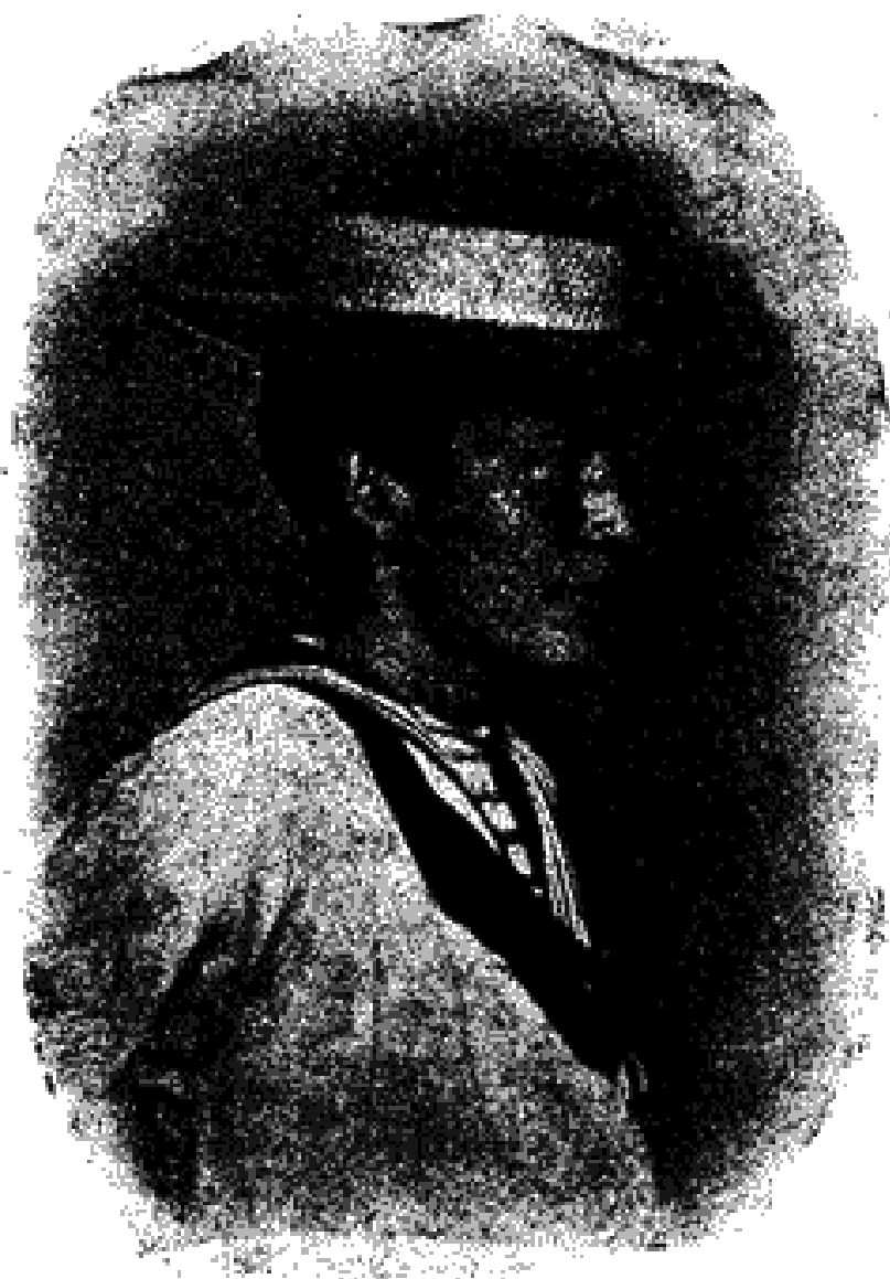
Ὁ Ἰων στὰ 1892.

πού προσβλέπει (στὸ ὀλίγο τότε διάστημα τῆς ἐνεργοῦ του ἀνάμιξης στὰ πράγματα) τὰ γενικότερα πολιτικὰ καὶ ἱστορικὰ προβλήματα τῆς ἐποχῆς αὐτῆς, σὲ συνδυασμὸ μ' αὐτὰ τὰ ἴδια αὐτῆς τῆς ὥρας ἐθνικὰ προβλήματα μας. Κι' αὐτό, βέβαια, ὄχι μόνο γιὰ τὸ τότε (1919-1920) τὸ πνεῦμα γενικὰ τῆς ἱστορίας εἶχε ἀρχίσει νὰ διαγράφει καθαρὰ τὶς προσπάθειές του, νὰ σχεδιάζει καὶ νὰ χρωματίζει τοὺς ἀπώτερους σκοπούς του ζωηρότατα παντοῦ, ἀλλὰ καὶ σύγχρονα γιὰ τὴν χάρη σὲ κείνη τὴν ἐσωτερικὴ ἀκριβῶς ὁποῦχε μόνος του κερδίσει καὶ ἀποκτήσει σκοπιά, ἢ προοπτικὴ ματιὰ του ἀρχίζε πλέον ν' ἀγκαλιάζει, ἀπὸ τὴν ἴδια φωτεινὴ τῆς σταθερότητα, ὀρίζοντες κατὰ πολὺ πλατύτερους ἀπ' τοὺς ὀρίζοντες πού ἀγκάλιαζε ὀλίγα χρόνια πρὶν. Περὶπτωσι πού ἀξίζει ἐδῶ νὰ τὸ τονίσουμε ἰδιαίτερα, ἐνάντια πρὸς τὰ δόγματα ὁποιοῦδήποτε τυχόν πολιτικοῦ ἐμπειρισμοῦ, πὼς καὶ στὶς σφαίρες τῆς πολιτικῆς μιὰ ἀληθινὴ κι' οὐσιαστικὰ δημιουργικὴ προοπτικὴ δὲν προσκολλάται ποτὲ ὁλόκληρη ἀπευθείας ἢ μὲ τούτους ἢ μὲ κείνους τοὺς σκοπούς, ἀλλὰ διαμένει γιὰ καιρὸ ἀποτραβηγμένη μὲς στὸ χῶρο τῆς ἀγνῆς θεώρησης τῶν καθαρὰ δημιουργικῶν ἱστορικῶν κινήτρων, πρὶν ἢ ἴδια σπεύσει νὰ ἐξωτερικεύσει ὁποιοδήποτε ἀμεσοπολιτικὸ σκοπὸ. Ἀποτέλεσμα καὶ τοῦτο ὄχι ὁποιοῦδήποτε καὶ ὅσοδήποτε εὐστροφου ἢ βίαιου καιρο-