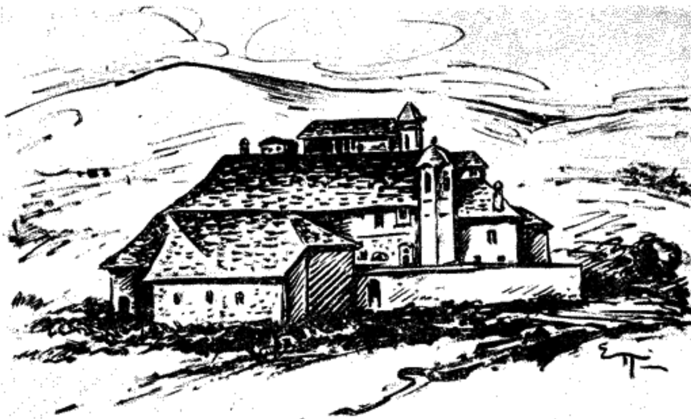
Ἡ ΜΟΝΗ ἸΩΑΝΝΟΥ ΤΟΥ ΘΕΟΛΟΓΟΥ ΟΠΟΥ ΗΤΑΝ ΕΓΚΑΤΕΣΤΗΜΕΝΟ ΤΟ ΤΥΠΟΓΡΑΦΕΙΟ ΤΗΣ ΜΟΣΧΟΠΟΛΕΩΣ (Ἰχθυογράφημα)

Και δείγματα τῆς μεγάλης αὐτῆς προσπάθειας, τῆς πρώτης πού σημειώθηκε στὴν ἱστορία τῶν βαλκανικῶν λαῶν ἔχουμε τις ἐργασίες τῶν καθηγητῶν τῆς Νέας Ἀκαδημίας. Ἐκεῖ συντάχθηκε και τυπώθηκε τὸ πρῶτο λεξικὸ τῆς κοινῆς ἑλληνικῆς με παράθεση τῆς μεταφράσεως τῶν λέξεων στὴν ἀλβανικὴ και στὴ βλάχικη ἀπὸ τὸ διευθυντὴ τῆς σχολῆς Θεόδωρο Ἀναστασίου Καβαλλιῶτη και πούχει τὸν τίτλο : « Λεξικὸν Ἑλληνικὸν Ἀπλοῦν και Βλαχικὸν και Ἀλβανικὸν ὑπὸ Θεοδώρου Ἀναστασίου Καβαλλιῶτου, Μοσχόπολις 1770 » (:) σελ. 1 - 98. Τὸν ἴδιο χρόνο ἀνατυπώθηκε στὴ Βενετιὰ μ' ἄλλη ἐπιγραφή ὡς « ΠΡΩΤΟΠΕΙΡΕΙΑ » παρὰ τοῦ σοφολογιωτάτου Διδασκάλου και Αἰδεσιμωτάτου Ἱεροκλήρου και Πρωτοπαπᾶ κυρίου Θεοδώρου Ἀναστασίου Καβαλλιῶτου τοῦ Μοσχοπολίτου συντεθεισα και νῦν πρῶτον τύποις ἐκδοθεῖσα δαπάνη τοῦ ἐντιμωτάτου και χρησιμωτάτου κυρίου Γεωργίου Τρίκουρα τοῦ και Κοσμήσκη ἐπιλεγομέ-