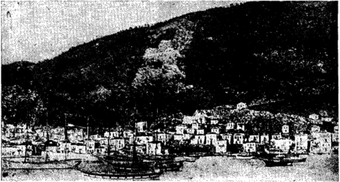
*Αποψη της Σκιάθου πριν από τα 1900.

άγιουργότες, ζούσε ακόμα την παρθένα ζωή του ραγιά, άποτραβηγμένος στη μοίρα του και στις προλήψεις του, στις συνήθειες και στα βίβιά του. Το κύμα του πολιτισμού δεν είχε ακόμα χτυπήσει την προβλήτα της ελληνικής έπαρχίας.