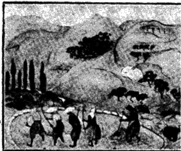
ΚΑ Χ. ΑΛΕΞΑΝΔΡΙΝΟΥ-ΣΤΕΦΑΝΟΠΟΥΛΟΥ : ΤΟ ΛΙΧΝΙΣΜΑ