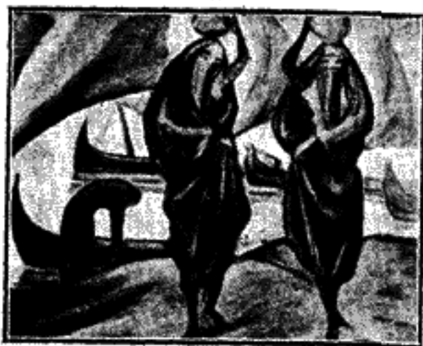
ΕΥΘ. ΠΑΠΑΔΗΜΗΤΡΙΟΥ : ΝΕΙΛΟΣ