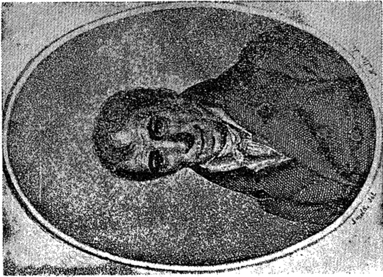
· Αδαμάντιος Κοραΐς (Δ 58)