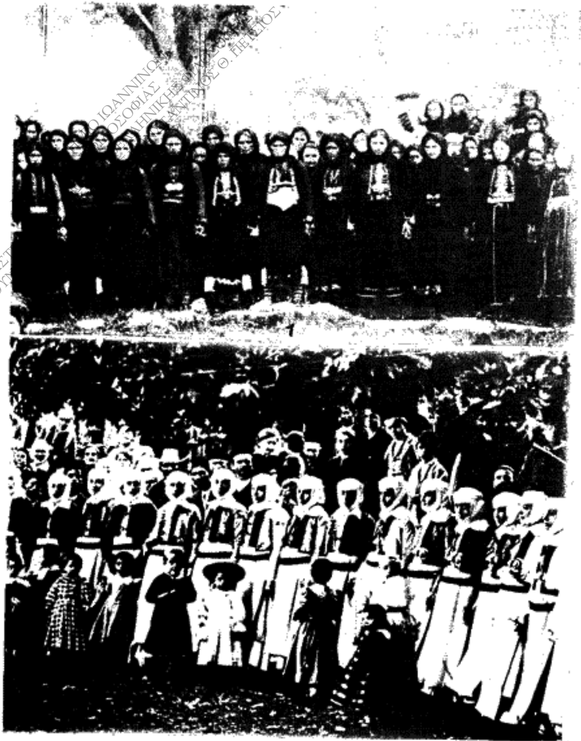
Εικ. 3, ἀριθ. 1.— Ένδυμασία επαρχίας Κουρσέντων, ἀριθ. 2. Ένδυμασία Πωγωνίου.