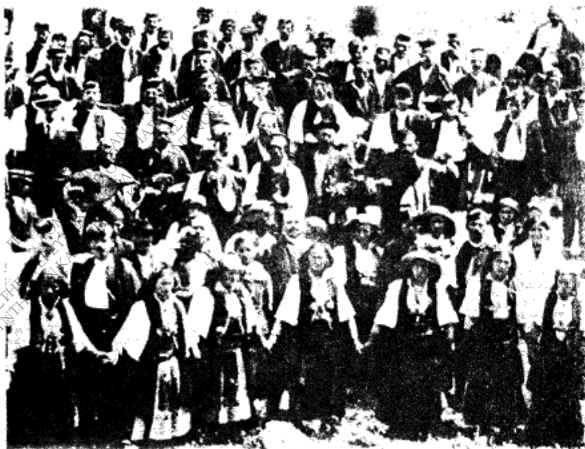
Εικ. 4. Ήνδυμασία Σουλίου.