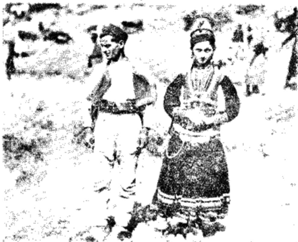
Εικ. 5. -Ήνδυμασία Αρβανιτοβλαχίας.