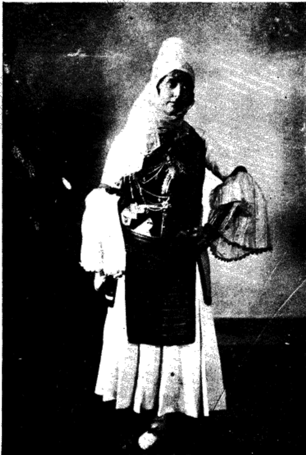
Εικ. 2.—'Ενδυμασία Αρβανουπόλεως.