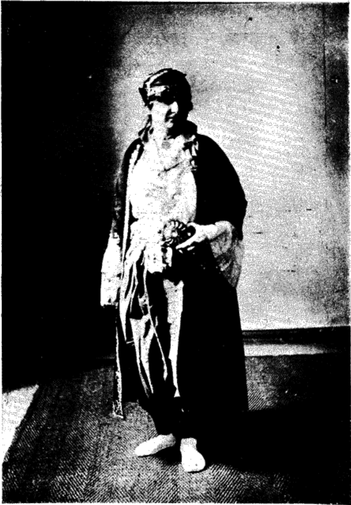
Εἰκ. 1.— Ἐνδυμασία Ἰωαννίνων.