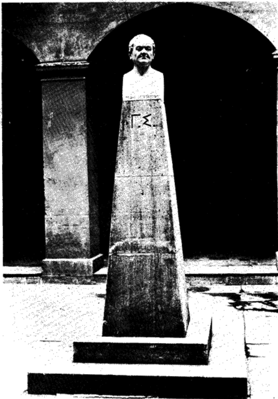
ΠΡΟΤΟΜΗ Γ. ΣΤΑΥΡΟΥ έν τῇ αὐλῇ τοῦ ἐν Ἰωαννίνοις Ὁρφανοτροφείου