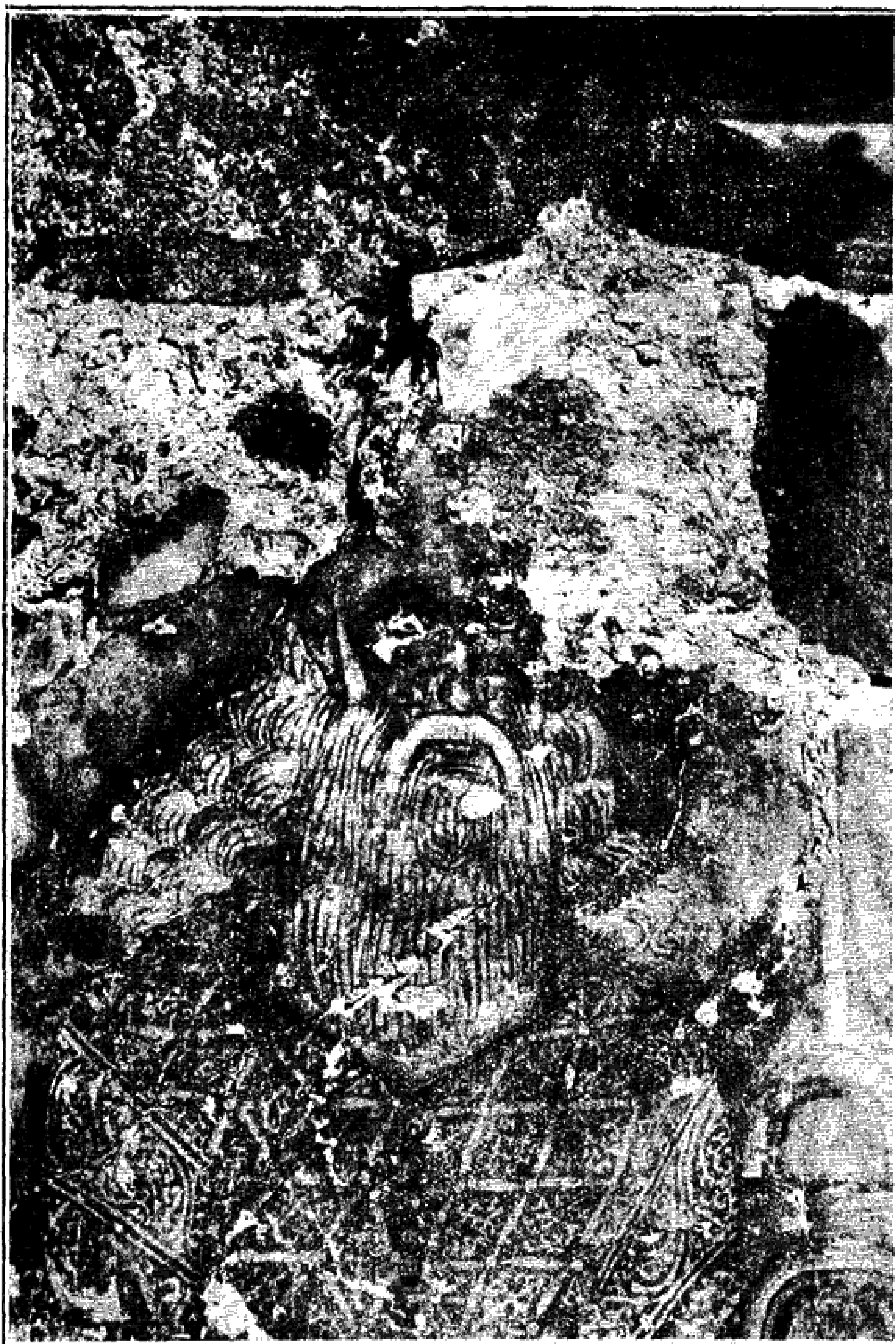
Εἰκ. 14. — Προσωπογραφία τοῦ κτίτορος πρωτοστράτορος Θεοδώρου.