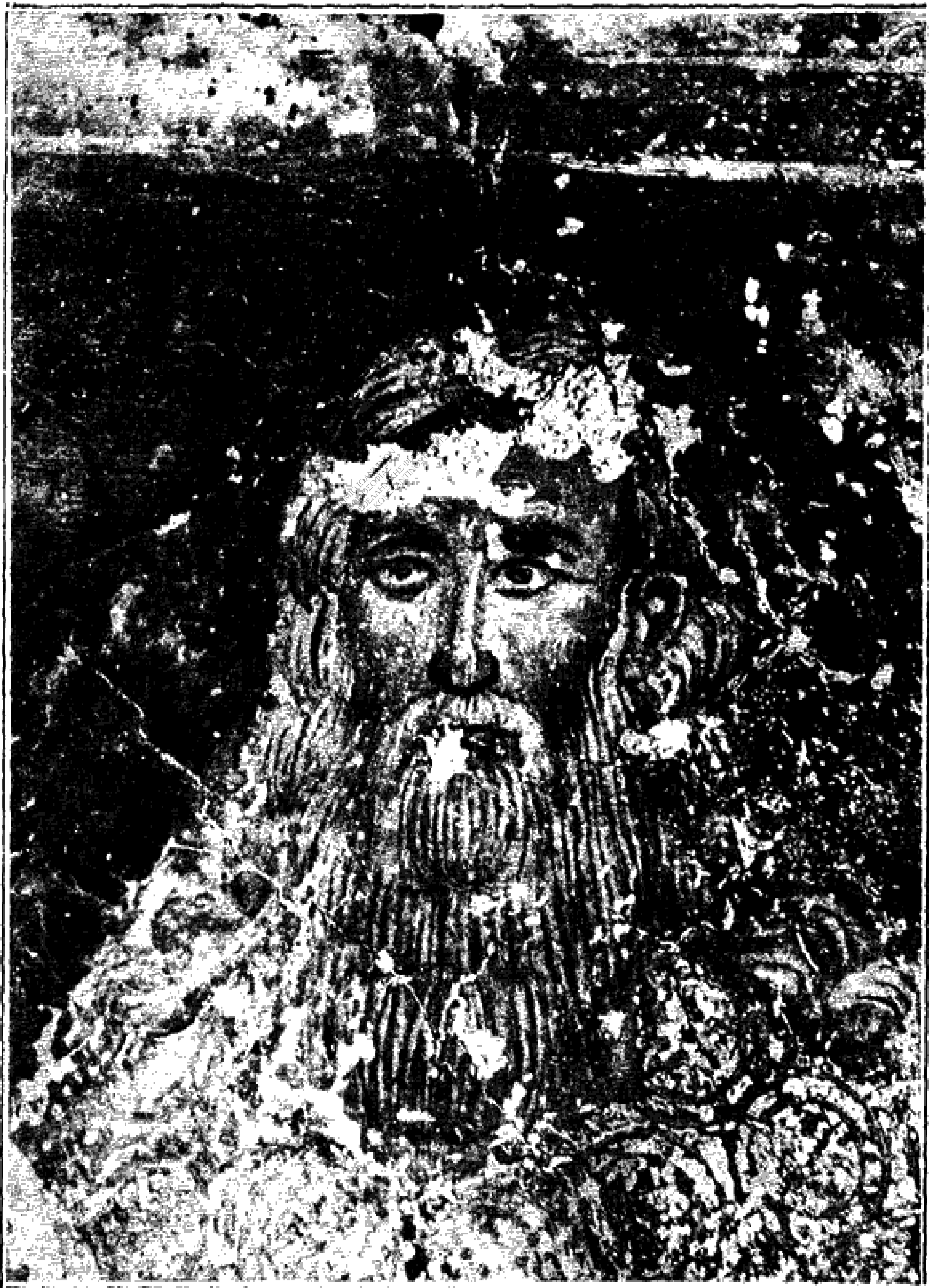
Είκ. 15. — Προσωπογραφία τοῦ Ἰωάννου Τζιμισκῆ, ἀδελφοῦ τοῦ κίτορος.