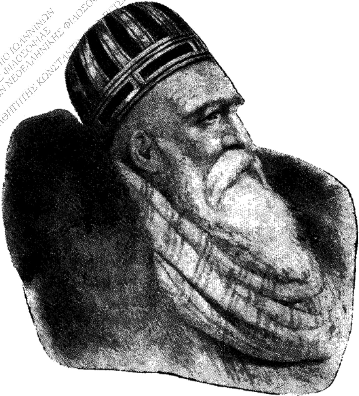
ΑΛΗΣ Ο ΤΕΠΕΛΕΝΑΗΣ (κατά παλαιάν χαλκογραφίαν)

ΠΑΝΕΠΙΣΤΗΜΙΟ ΙΩΑΝΝΙΝΩΝ ΤΟΜΕΑΣ ΦΙΛΟΣΟΦΙΑΣ ΕΡΓΑΣΤΗΡΙΟ ΕΡΕΥΝΩΝ ΝΕΟΕΛΛΗΝΙΚΗΣ ΦΙΛΟΣΟΦΙΑΣ ΔΙΕΥΘΥΝΤΗΣ: ΕΠ. ΚΑΘΗΓΗΤΗΣ ΚΩΝΣΤΑΝΤΙΝΟΣ ΠΕΤΣΙΟΣ