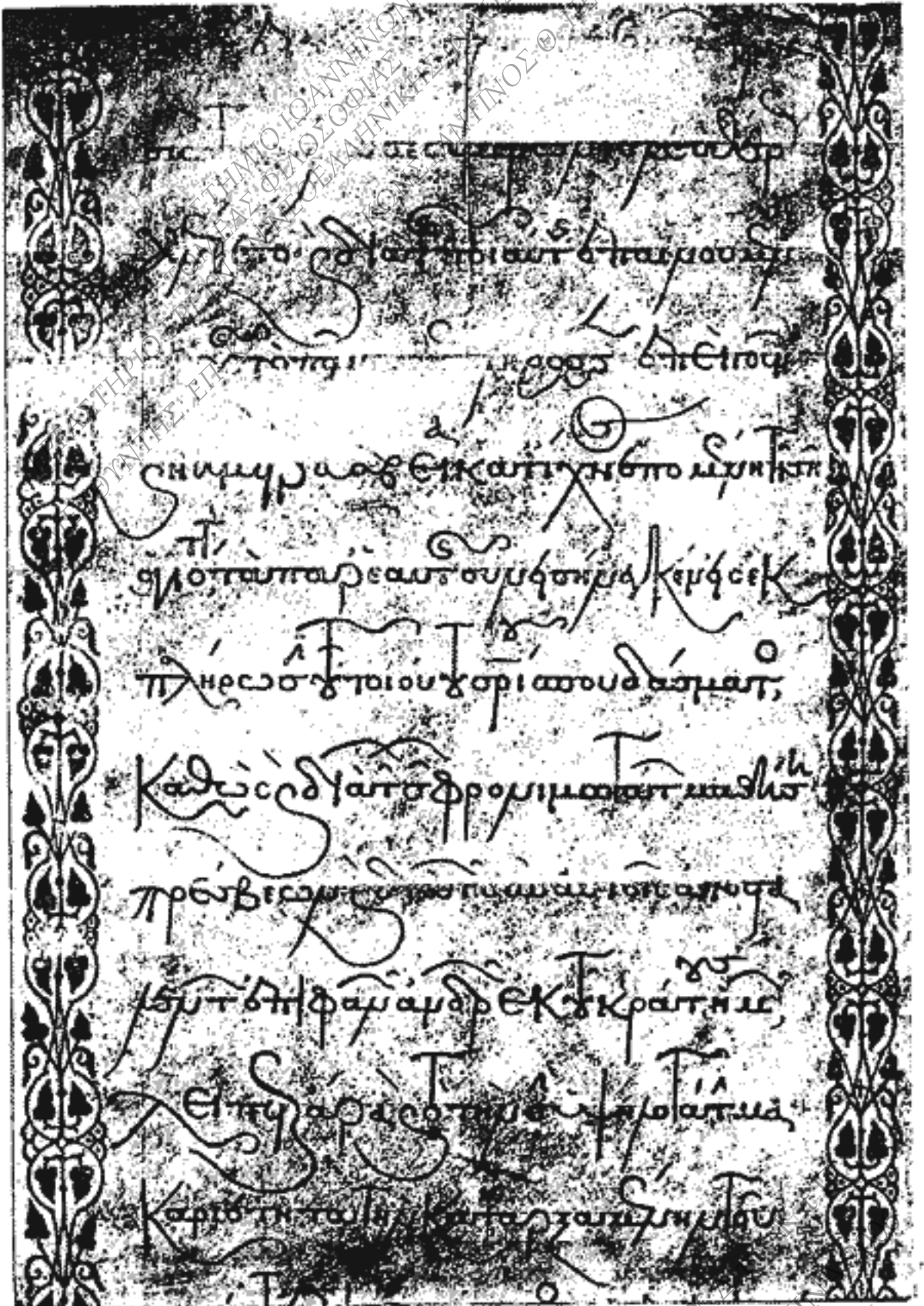
ΧΡΥΣΟΥΝ ΓΡΑΜΜΑ ΙΩΑΝΝΟΥ ΚΟΜΝΗΝΟΥ (1126) ΕΝ ΤΩ ΑΡΧΕΙΩ ΤΟΥ ΒΑΤΙΚΑΝΟΥ (Κόλλα πέμπτη)