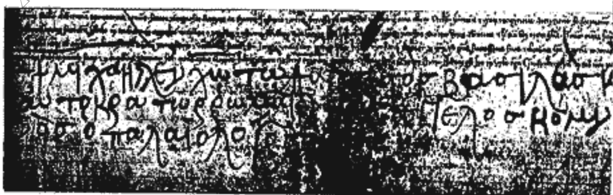
ΥΠΟΓΡΑΦΗ ΤΟΥ ΑΥΤΟΚΡΑΤΟΡΟΣ ΜΙΧΑΗΛ ΠΑΛΑΙΟΛΟΓΟΥ ΜΕΤΑ ΤΩΝ ΤΕΛΕΥΤΑΙΩΝ ΣΤΙΚΩΝ ΤΟΥ ΥΠ' ΑΡΙΘ. 7 ΛΑΤΙΝΙΚΟΥ ΧΡΥΣΟΒΟΥΛΛΟΥ

quenter suprascriptis iurat sic. Ego Michael in Christo deo fidelis Imperator et Moderator Romeorum Ducas Angelus Comunitus Paleologus. Omne Sysma prorsus abiuro et suprascriptam fidei veritatem prout plene lecta est et fideliter exposita veram. Sanctam Catholicam et orthodoxam fidem esse cognosco eam accepto, et corde et ore profiteor, ipsamque prout eam veraciter tenet, fideliter docet, et predicat Sacrosancta Romana Ecclesia me inviolabiliter servaturum. nec ab ea ullo umquam tempore recessurum vel quoquo modo deviaturum vel discrepaturum promitto. Primatum quoque ipsius Sacrosancte Romane Ecclesie, prout in premissa serie continetur ad ipsius Ecclesie obedientiam spontaneus veniens fateor. recognosco. accepto ac sponte suscipio et omnia premissa tam circa fidei veritatem, quam circa eiusdem Ecclesie primatum et ipsorum recognitionem acceptionem, susceptionem, obser-