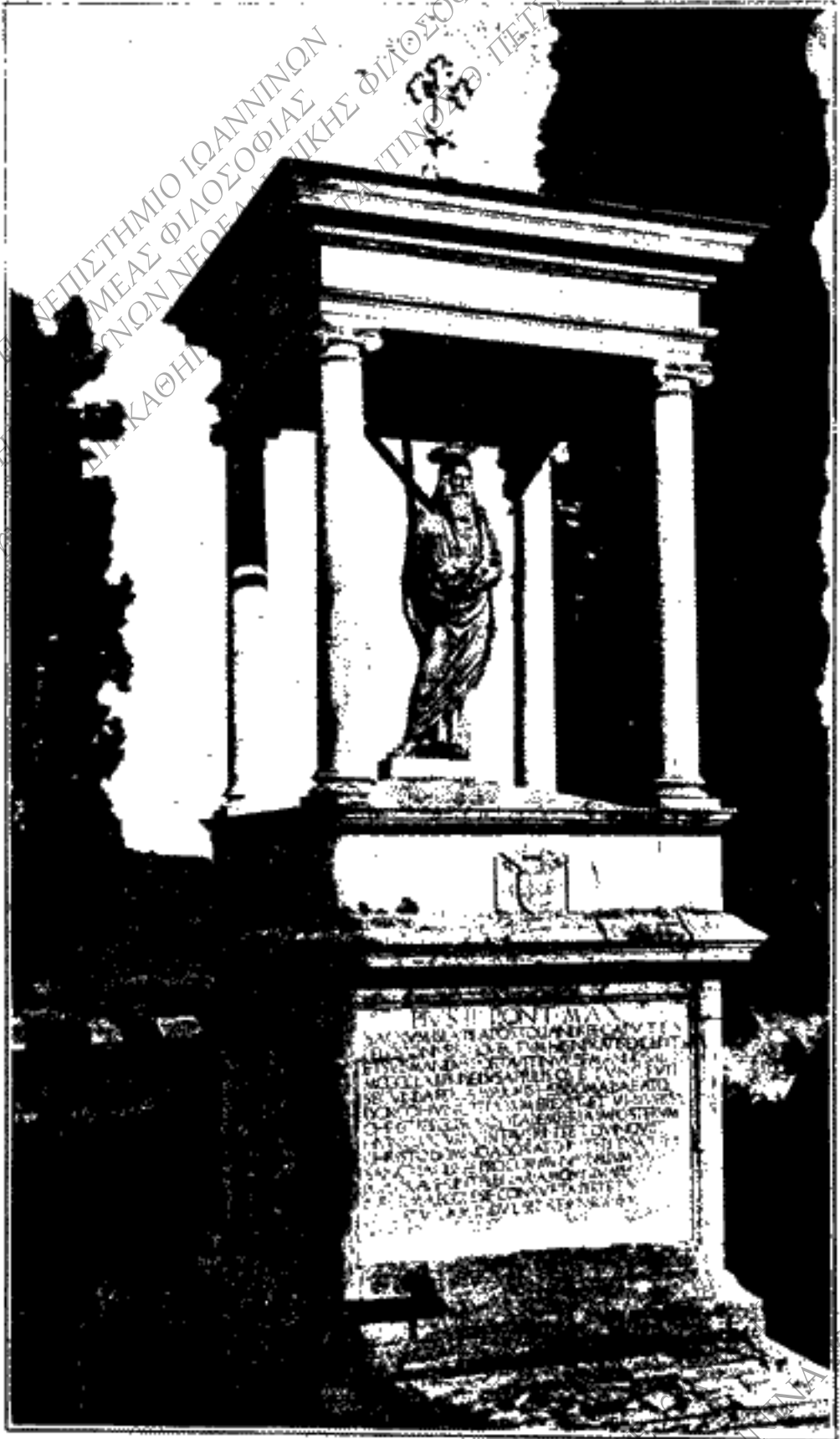
Τὸ εὐκτήριον τοῦ Ἁγίου Ἀνδρέου παρὰ τὴν Μουλδίον γέφυραν.