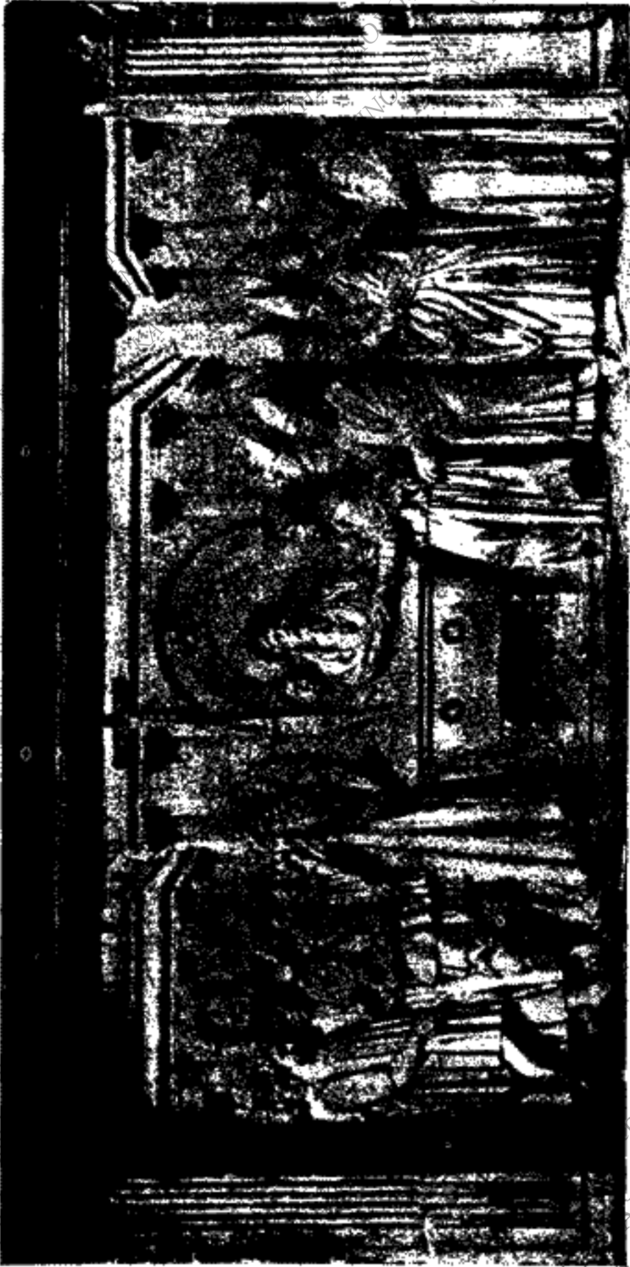
Ἡ ἀνακομιδὴ τῆς κάρας τοῦ ἁγίου Ἀνδρότσι. Ἀνάγνωστον ἐν τῷ μνημείου τοῦ πάπα Πίου Β' ἐν τῇ κατὰ τὴν Ῥώμην ἐκκλησίᾳ τοῦ ἁγίου Ἀνδρέου (S. Andrea della Valle).