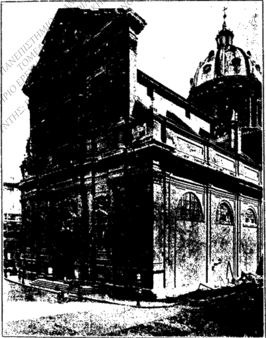
Ἡ ἐν Ῥώμῃ ἐκκλησία τοῦ ἁγίου Ἀνδρέου τοῦ ἐν τῇ κοιλάδι (S. Andrea della Valle).