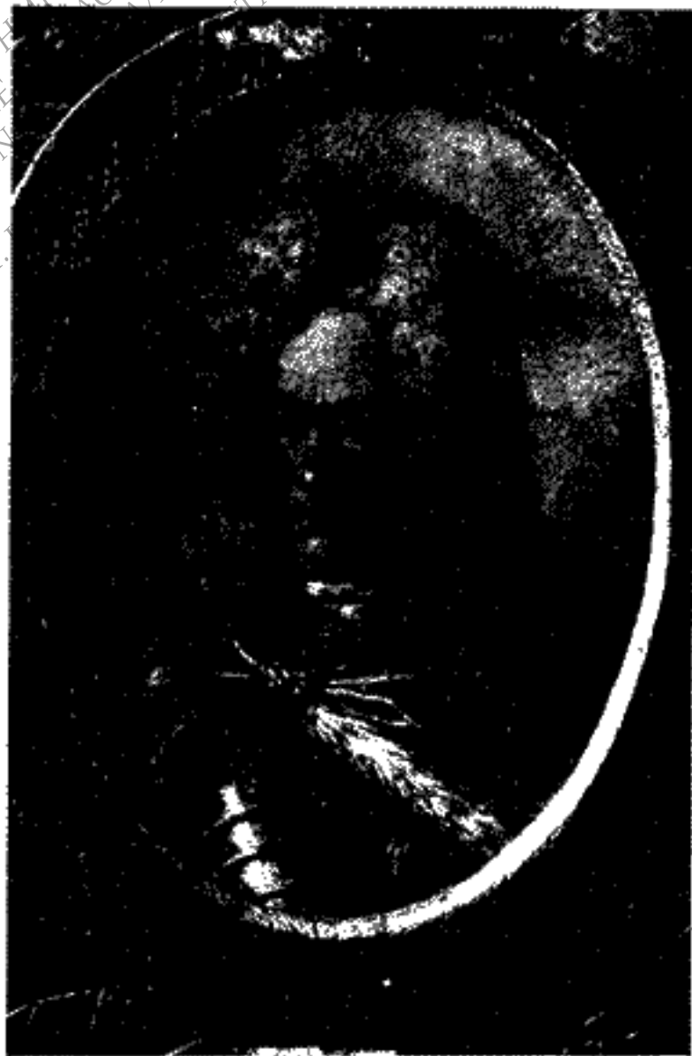
Ζωγραφία τοῦ κόμισιτος Ἰωάννου von Schulenburg ὑπὸ Παναγιώτου Δοξαρά.

τῆς ζωγραφίας τοῦ Δοξαρά εἵκαιρον κρίνω νὰ σημειώσω, ὅτι προσεχῶς ἐλπίζω νὰ θυνῆθαι νὰ παράσχω εἰδήσεις καὶ περὶ