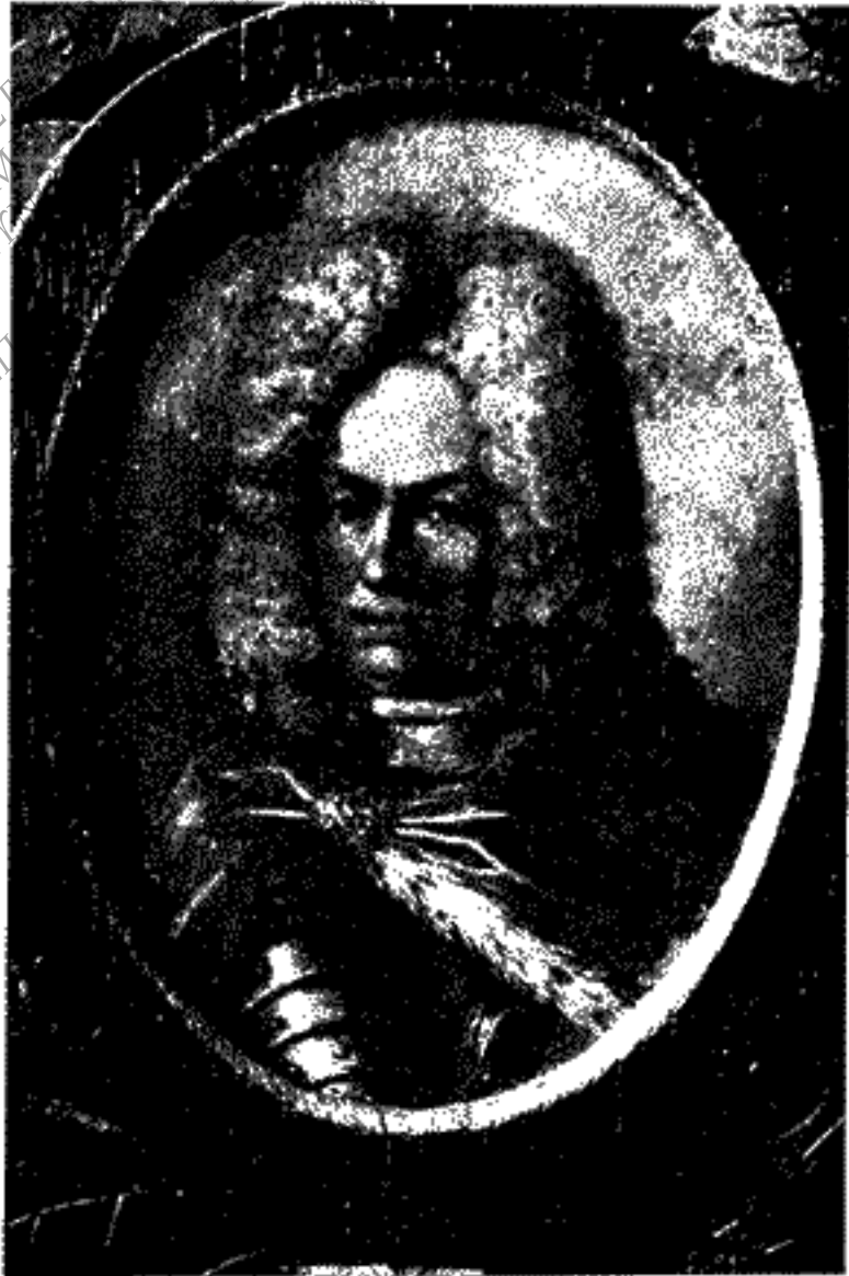
Η ΕΝ ΤΗ ΙΣΤΟΡΙΚΗ ΕΓΑΙΡΕΙΑΙ ΖΩΓΡΑΦΙΑ ΤΟΥ ΔΟΞΑΡΑ Μ ΠΑΡΙΣΤΑΝΟΥΣΑ ΤΟΝ ΚΟΜΙΤΑ SCHULENBURG