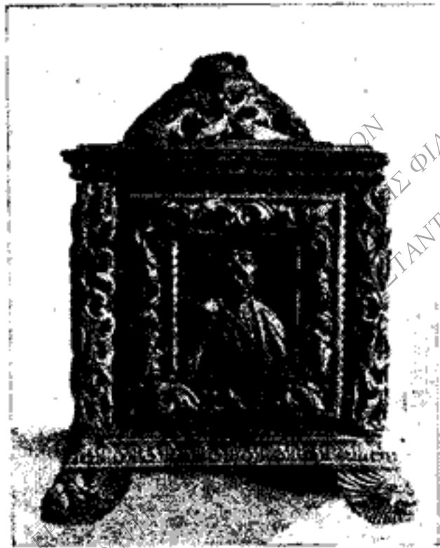
Εἰκὼν 3. ΡΗΓΑΣ ΒΕΛΕΣΤΙΝΑΗΣ