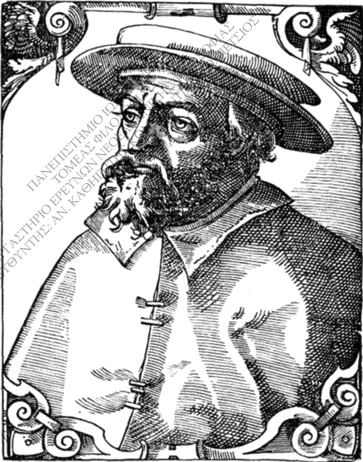
ΕΙΚΩΝ ΤΟΥ ΙΩΑΝΝΟΥ ΑΡΓΥΡΟΠΟΥΛΟΥ