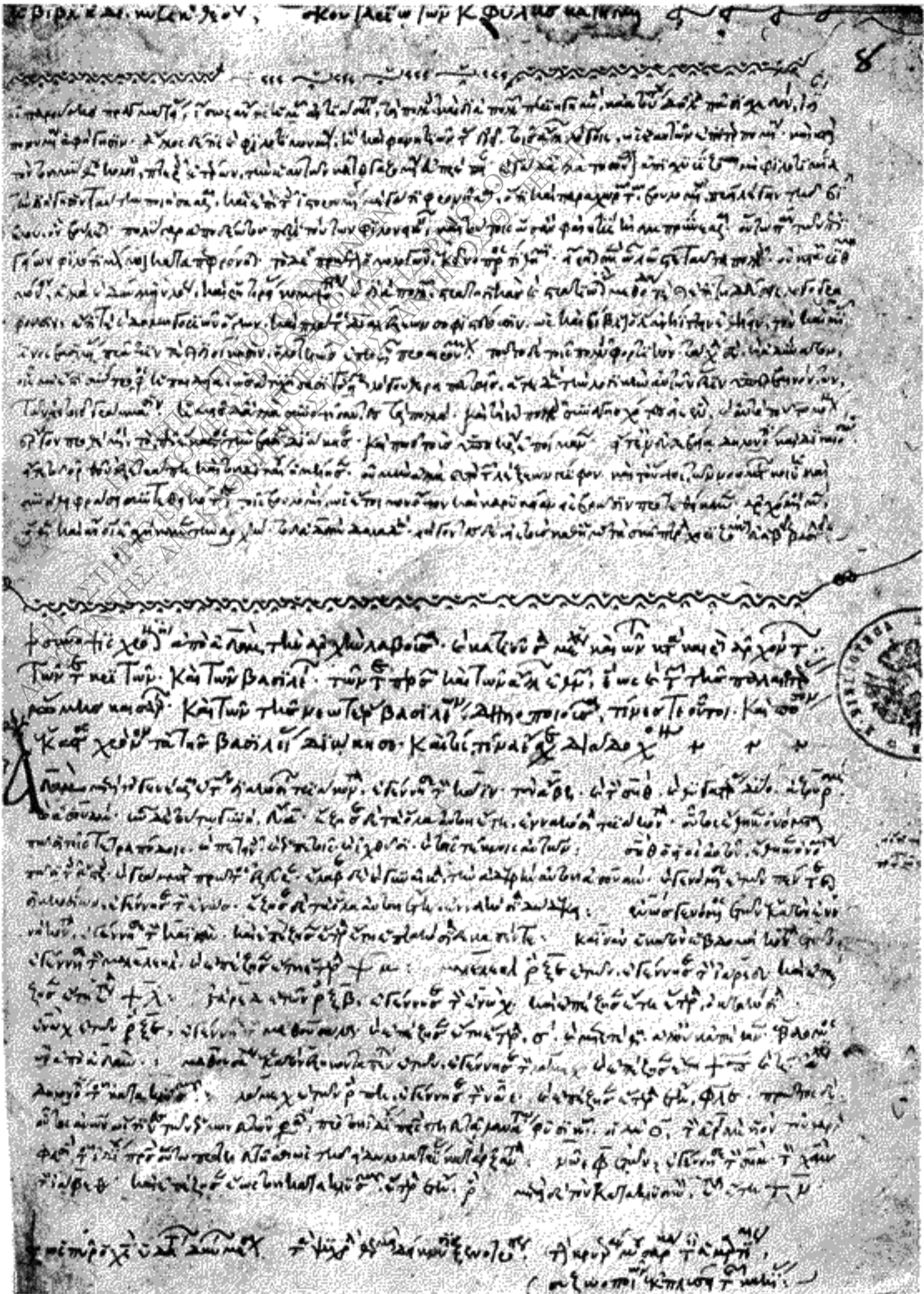
ΠΑΝΟΜΟΙΟΥΤΥΠΟΝ ΤΟΥ ΜΑΡΚΙΑΝΟΥ ΚΩΔΙΚΟΣ 407 φ. 8α.