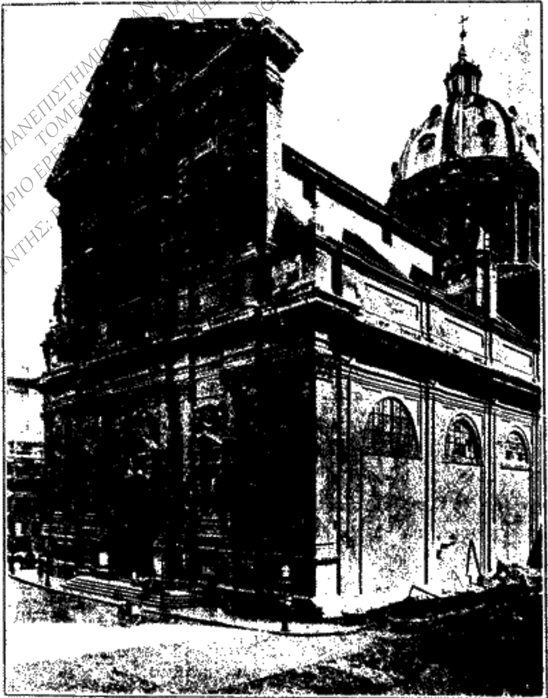
Ἡ ἐν Ῥώμῃ ἐκκλησία τοῦ ἁγίου Ἀνδρέου τοῦ ἐν τῇ κοιλάδι (S. Andrea della Valle).