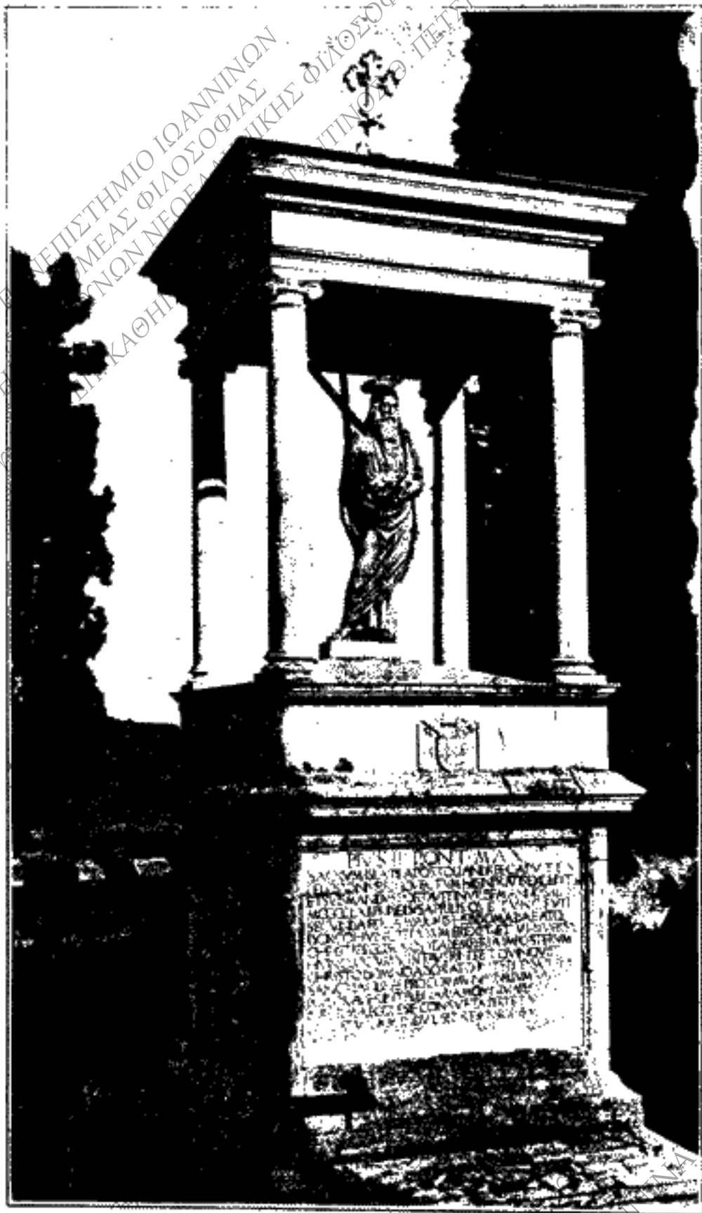
Τὸ εὐκτήριον τοῦ Ἁγίου Ἀνδρέου παρὰ τὴν Μουλδίαν γέφυραν.