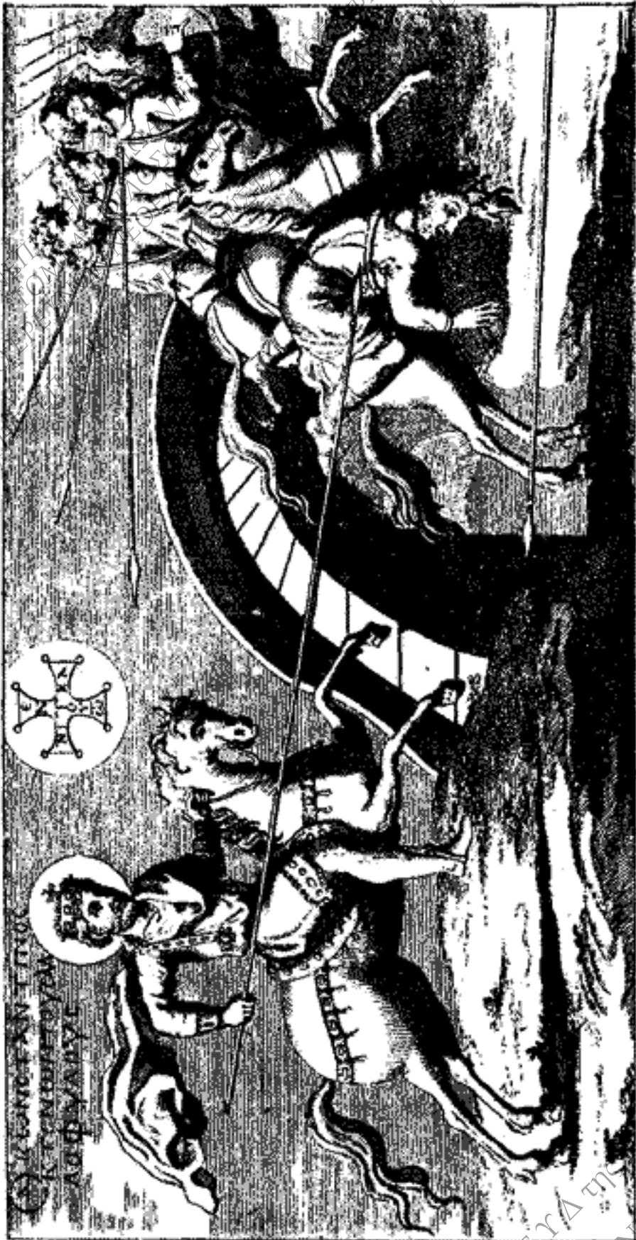
Ἡ παρὰ τὴν Μουλαδίαν γέφυραν νίκη τοῦ Κωνσταντίνου.