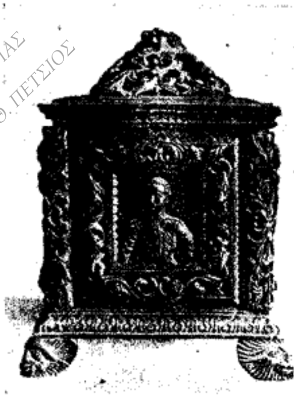
Εἰκὼν 4. ΑΛΕΞΑΝΔΡΟΣ ΥΨΗΛΑΝΤΗΣ