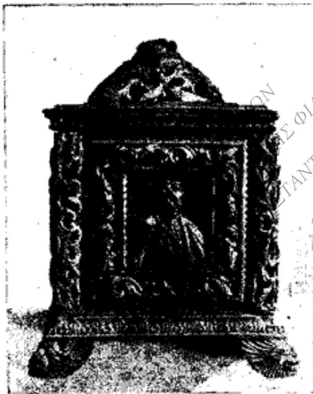
Εἰκὼν 3. ΡΗΓΑΣ ΒΕΛΕΣΤΙΝΑΗΣ